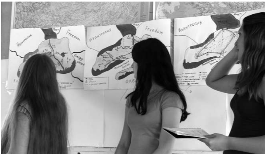
Текст иллюстрируют фотографии, снятые на летней сессии «Школы гуманитарного образования» в 2007 году, Горный Алтай.

Постепенно проект переходит к массовому действию, де-индивидуализируется. Его масштабом становится географическая территория — город, регион, страна. Эта трансформация становится очень болезненной для тех, кто «все это начал». Многие приходят, многие и уходят. Остаются те, кто стал проблемой для самого себя, и для кого этот проект становится