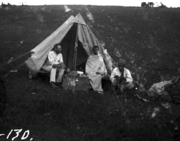
«Высока была его палатка...». Николай Гумилев в Абиссинии (1913 г.,).