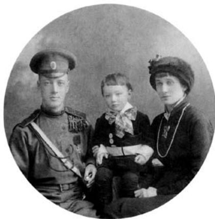
Николай Гумилев и Анна Ахматова с сыном (фото 5 апреля 1915 г., поэту только что исполнилось 29 лет).