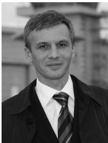
Алексей Сафиоллин, заместитель Председателя Правительства Ханты-Мансийского автономного округа-Югры, Ханты-Мансийск

Два года прошло с тех пор, как появились первые сообщения: Михаил Шемякин проектирует театр, который будет построен в Ханты-Мансийске. Об этом проекте и о его месте в архитектурно-градостроительной политике столицы округа наша беседа с заместителем Председателя Правительства Ханты-Мансийского автономного округа-Югры Алексеем Сафиоллиным.