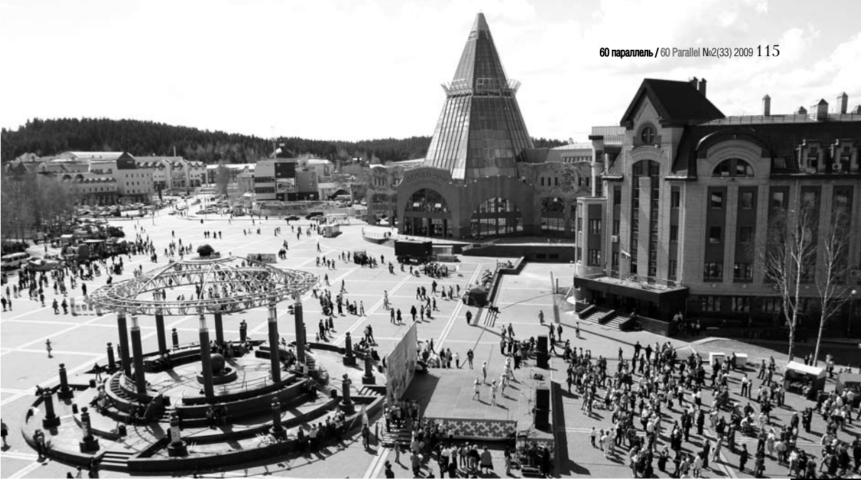
Вид на центральную площадь Ханты-Мансийска.

И периоды развития среды в югорских городах, с точки зрения новой истории, можно было бы уже разделить на три этапа. В первый период активного освоения недр — 1970-80е годы — сюда ежегодно вкладывались средства, равные двукратной стоимости БАМа. В то время руководство решало две государственных задачи — в нефтедобыче достигнуть 1 млн. тонн нефти в день, а в гражданском строительстве — добиться 1 квадратного метра капитального жилья на каждого человека. Какое это было жильё и какая архитектура — об этом говорить мы не будем. Подходы объяснялись представлением большинства о временном пребывании на этой земле, люди приезжали сюда просто на заработки, они не связывали свою жизнь с Севером и собирались вернуться на Большую Землю, на свою родину.