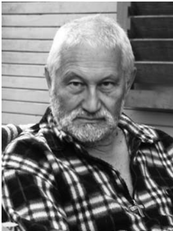
Александр Раппапорт, архитектор, теоретик искусства, критик, авторский блог: raparades.blogspot.com Санкт-Петербург