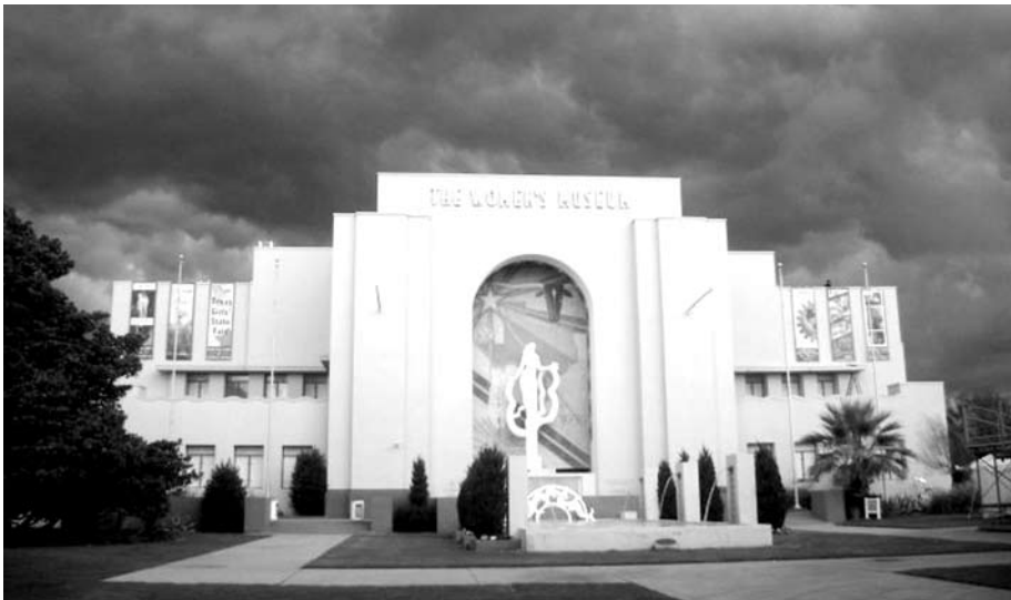
The Women's Museum. Даллас, штат Техас, США