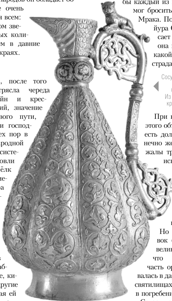
Сосуд. X-XI вв. Византия. Случайная находка. Сургутское Приобье. Из фондов Сургутского краеведческого музея.

Судя по легендам, местному населению клинки нужны были не для войны, вернее — не только, а ещё и для того, чтобы каждый из них раз в году мог бросить саблю в море Мрака. Потому что «если йура (угрич) не бросает в воду мечи, то она не поймает никакой рыбы и будет страдать от голода».