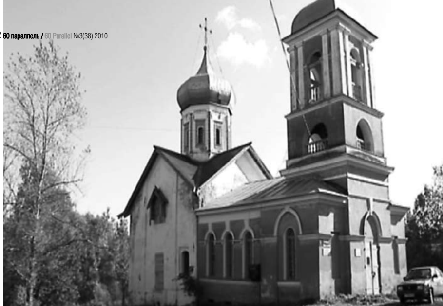
Церковь Белой Троицы. 1365 год, Великий Новгород. Фото 2007 года.