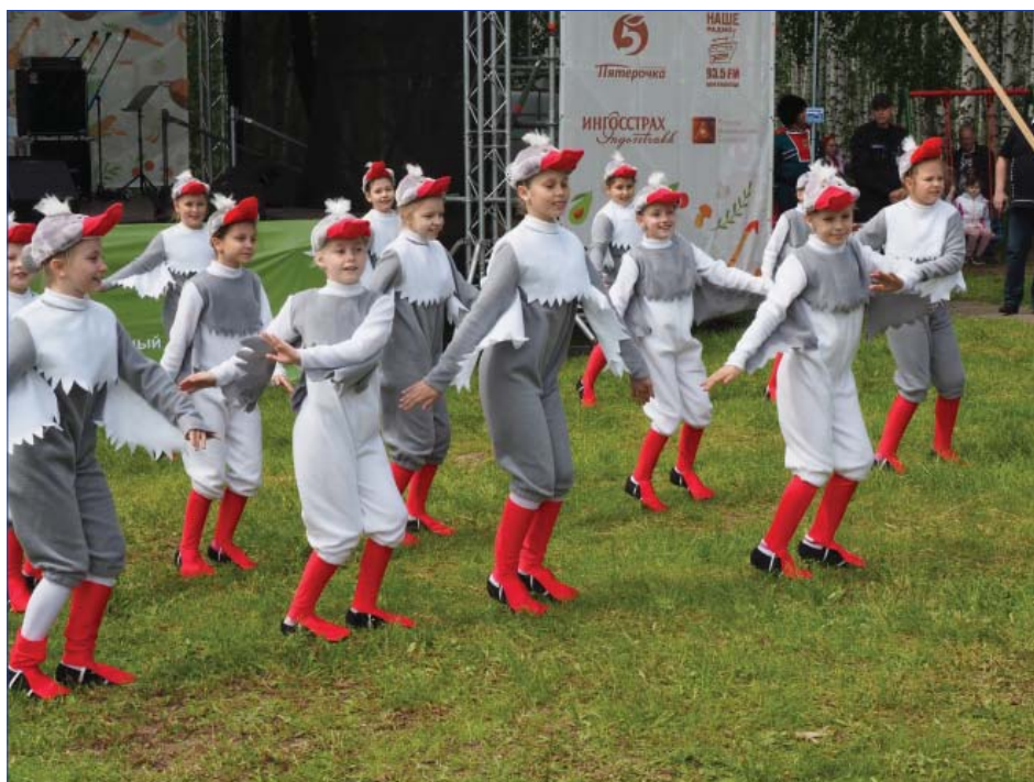
Детский ансамбль «гусят».