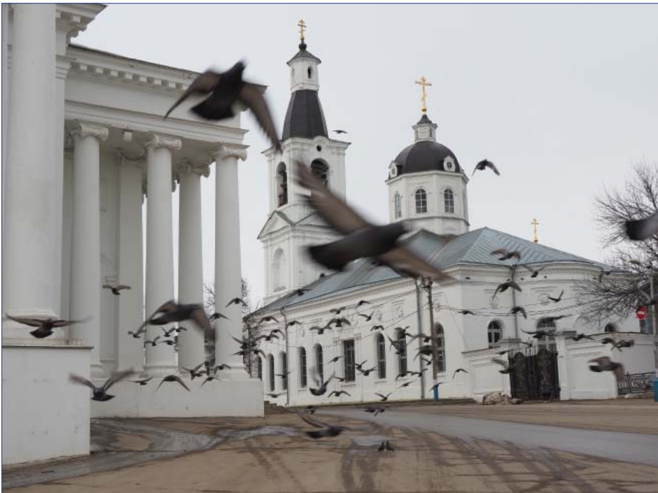
Величественный Воскресенский собор — главная святыня и достопримечательность Арзамаса — мог бы украсить любую из двух российских столиц. Мимо не пройдешь.