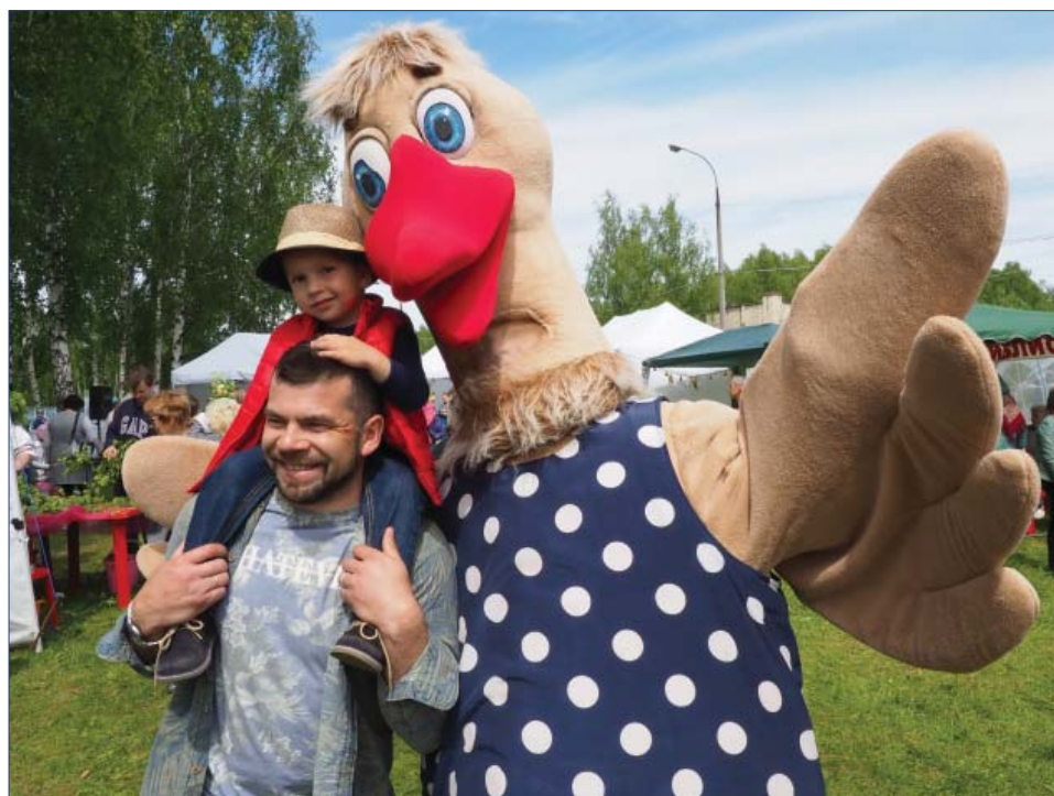
Как не сфотографироваться на память с таким красавцем?