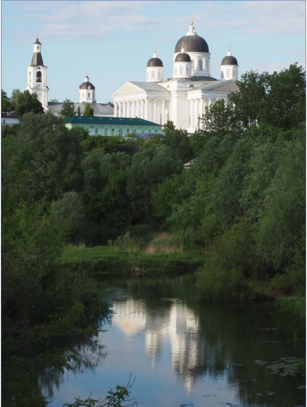
Вид на церковь Смоленской иконы Божией Матери.