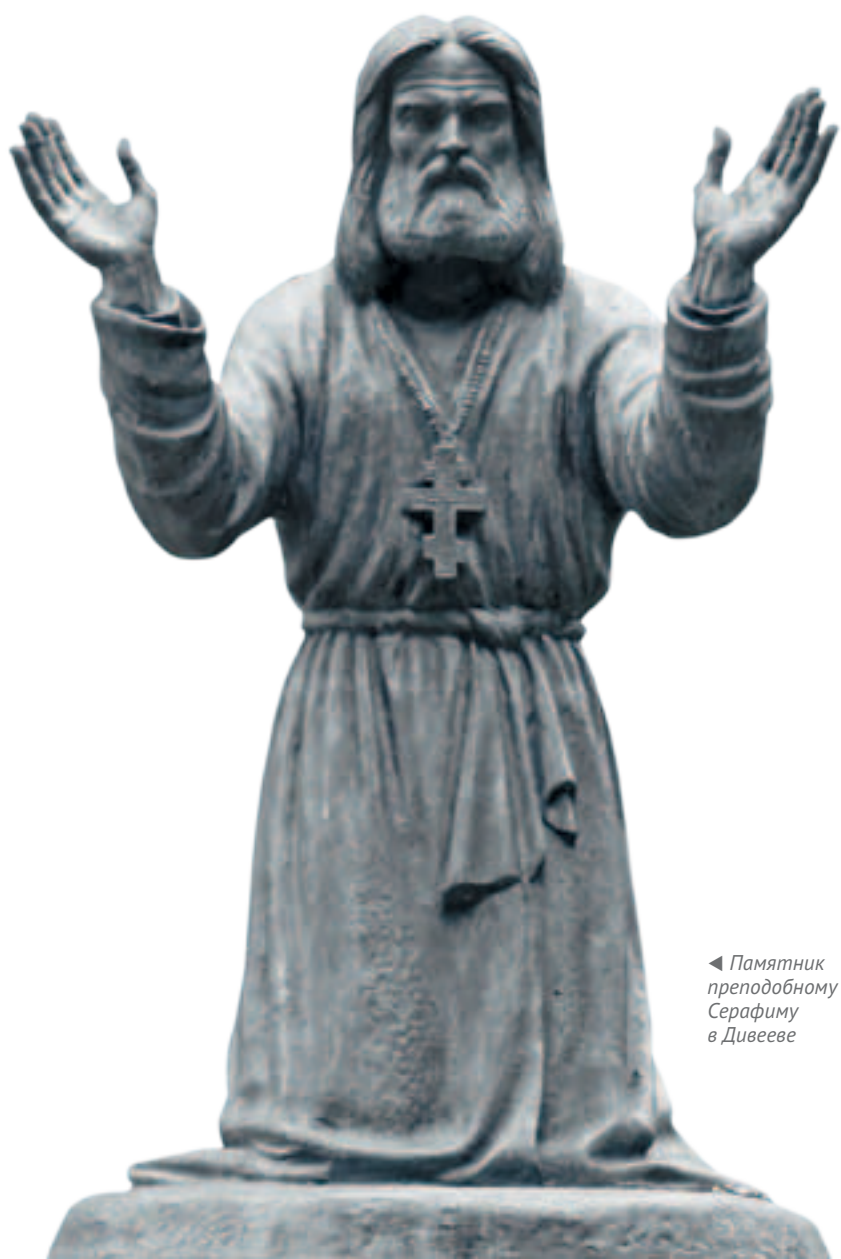
◀ Памятник преподобному Серафиму в Дивееве

Подвиги бывают разными. Могут быть на войне... а могут быть тоже на войне, только война эта не физическая, а духовная. Война за свою душу, война против духов зла, война против своей слабой, испорченной грехом природы. Тех, кто совершает такой подвиг, Церковь называет преподобными — то есть ставшими подобным Богу. Таков преподобный Серафим Саровский — великий святой нашей Церкви.