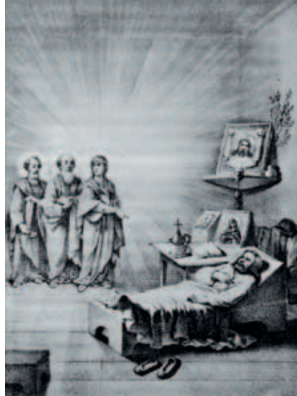
▲ Явление Богородицы прп. Серафиму во время болезни. Литография, 1885

Митрополит Вениамин (Федченков) писал в своей книге о преподобном, что в каждого, кто к нему приходил, он точно «впрыскивал жизненную силу, светлую радость, подъем духовного напряжения, крепость в добре, желание исправления. Кратко сказать: пламенный Серафим зажигал людей огнем и благодатным духом возрождения».