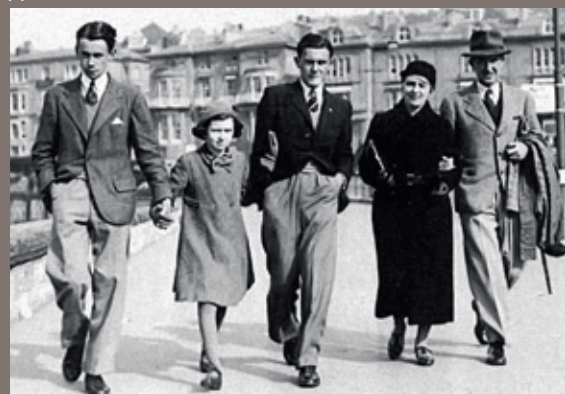
Д. Р. Р. Толкин с семьей