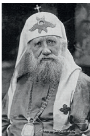
Святитель Тихон патриарх Московский и всея Руси (1865-1925 гг.)

Байдарки и пароходы, моржи и алеуты... Как епископ за 78 дней всю Аляску объехал