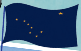
герб и флаг Аляски