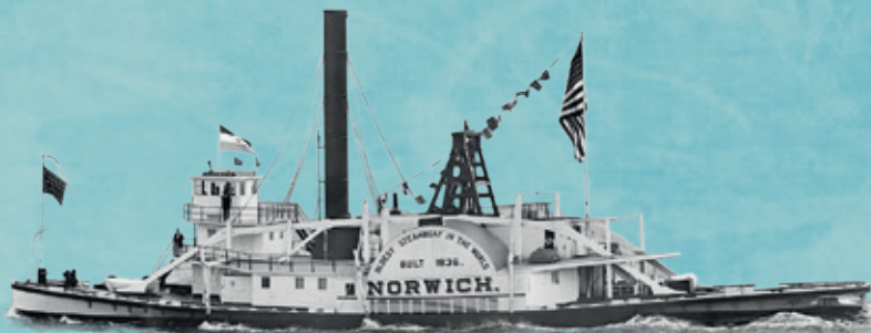
Такие пароходы ходили по рекам и морям во времена епископа Тихона.