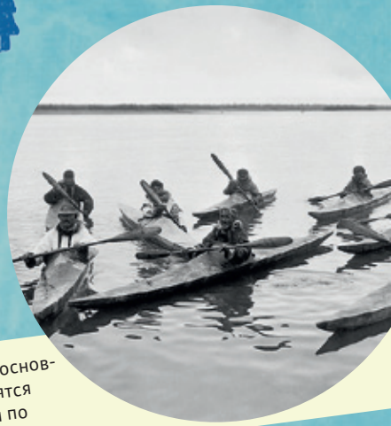
Алеуты в основном охотятся группами по 15-20 человек

Киль — нижняя балка или балки, проходящие посередине днища судна