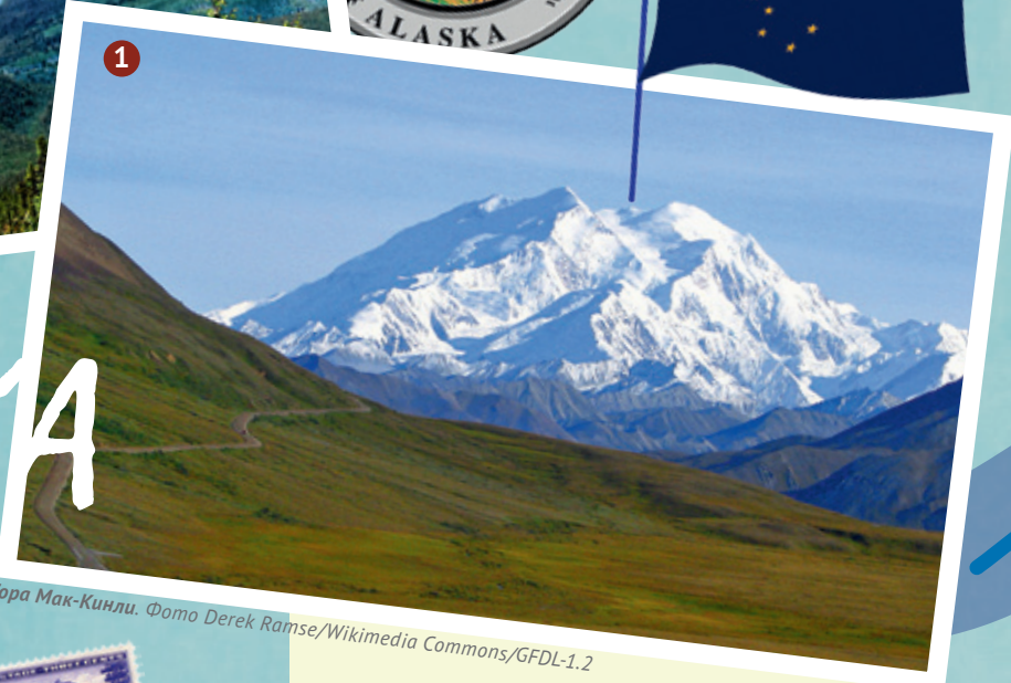
Гора Мак-Кинли.