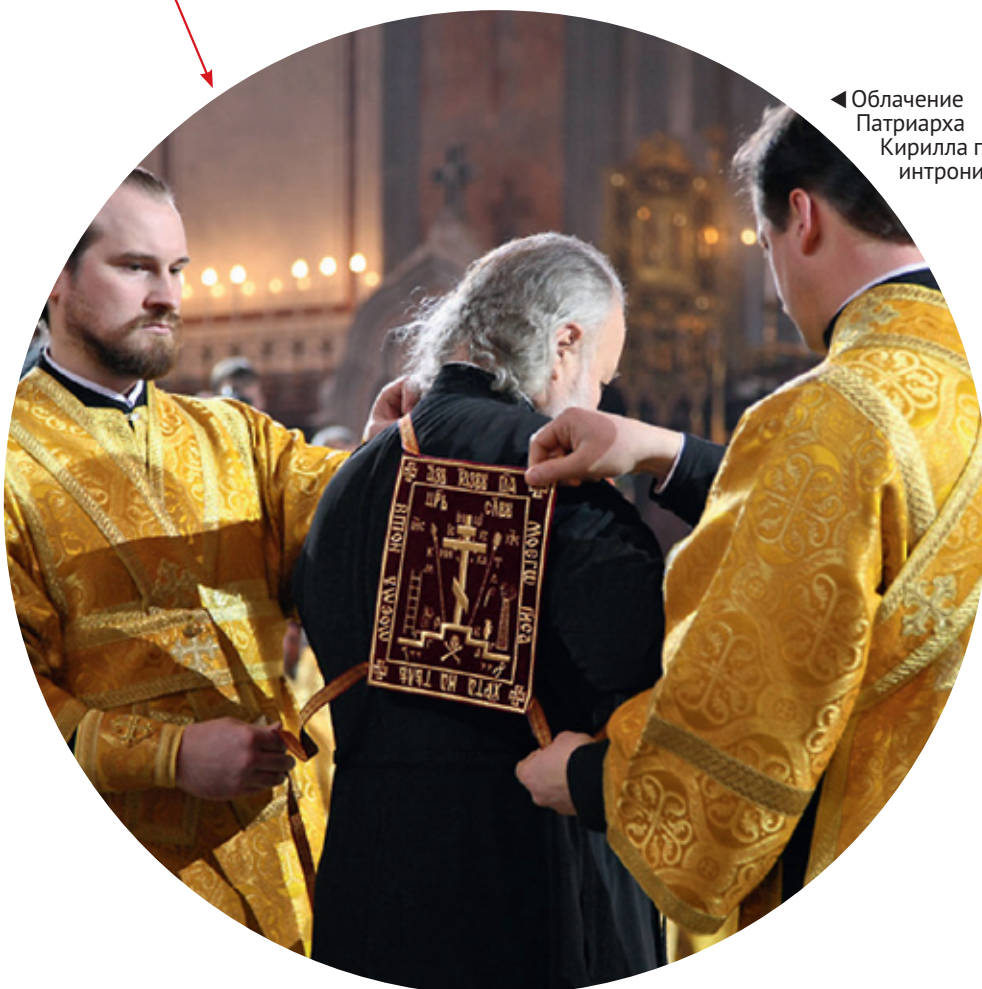
◀ Облачение Патриарха Кирилла перед интронизацией

Великий — носит Патриарх Московский и вся Русь, надевая его поверх подрясника только перед богослужением.