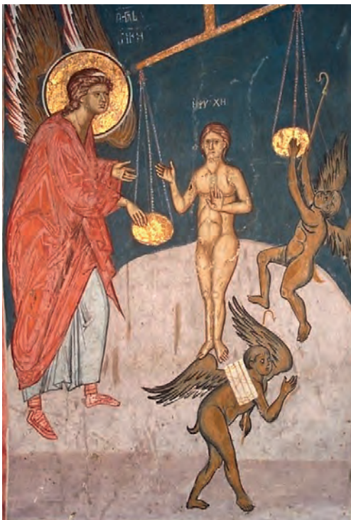
Страшный суд. Фрагмент фрески. Монастырь Дечаны, XIV в.

как быть, если не получается насовсем оставить греховное поведение и после искреннего покаяния опять возвращаешься к старому?