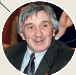
Юрий Щекочихин , журналист-расследователь и общественник