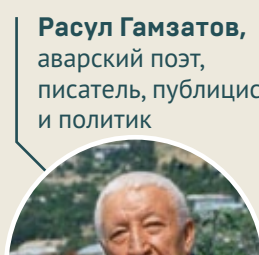
Расул Гамзатов , аварский поэт, писатель, публицист и политик