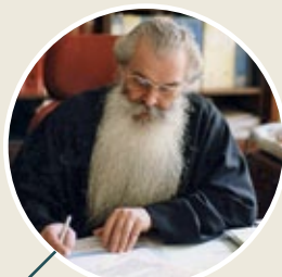
Питирим (Нечаев) , митрополит Волоколамский и Юрьевский