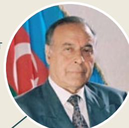
Гейдар Алиев , президент Азербайджана