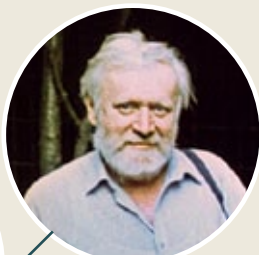
Кир Булычев , известнейший советский писатель-фантаст