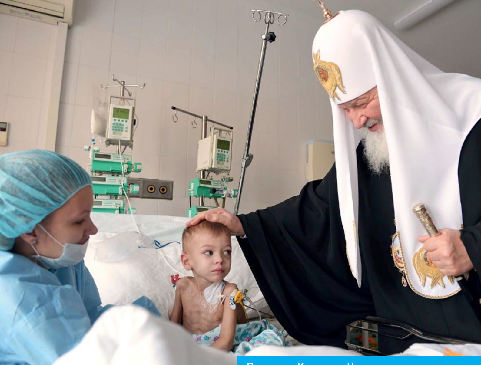
Патриарх Кирилл в Научно-исследовательском институте детской онкологии и гематологии в Москве