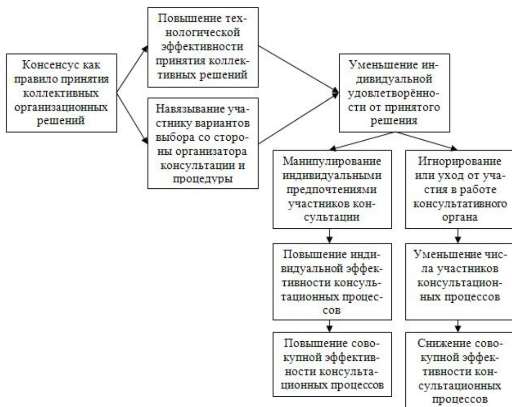
Рисунок 3. Схема-интерпретация «парадокса ограниченного выбора»

Исторически с 1950-х гг. эффективность определялась как одно из ключевых свойств международной консультации и со временем превратилась в фактор, оказывающий регулируемое влияние на ход консультационного процесса. Обнаружена прямая зависимость технологической эффективности консультаций, измеряемой в настоящем исследовании индексом технологической эффективности, от степени манипулирования правилами принятия организационных решений. Консенсус наряду с правилом диктатуры и правилом Нэнсона относится к наименее манипулируемым правилам по шкале Нитцана-Келли, что не даёт возможности участникам консультации изменять консультационные нормы и процедуры для реализации своих частных интересов (осознанных потребностей).