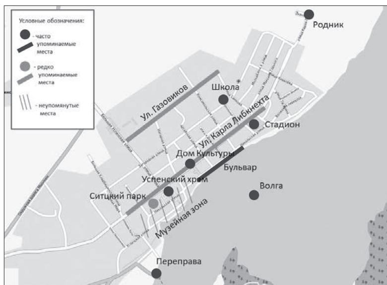
Рис. 2. Карта Мышкина и места с высокой долей упоминаний в скетчах города 9 .

Как мы уже отметили выше, для Мышкина характерна высокая однородность описания города, то есть существенное сходство в наборе мест при описании города местными жителями. Примерно каждый третий упоминает определенный набор мест, которые являются важными для формирования образа города (четыре и более упоминания) (см. рис. 2). В основном это места, играющие важную роль в повседневной жизни города. Среди них так называемый «бульвар» – набережная Волги, основное место прогулок, с которого открывается вид на реку; дом культуры, в котором проводятся разного рода мероприятия и показы фильмов; единственная общеобразовательная школа; родник, на который местные жители ходят за питьевой водой (из-за низкого качества водопроводной воды); Успенский храм с прилегающей центральной площадью, где проходят общегородские праздники; станция паромной переправы, которая, за неимением моста, является ближайшим местом, через которое осуществляется связь с противоположным берегом. Чуть реже (три упоминания) в скетчах города встречаются улица Карла Либкнехта – основная транспортная артерия города, и улица Газовиков, на которой в пятиэтажных кварталах проживает значительная часть жителей.