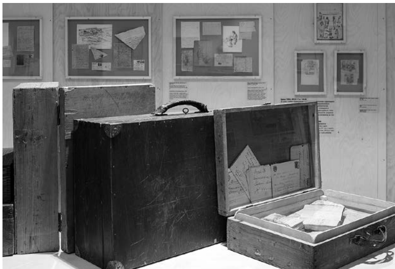
Рис. 1. Экспонаты и стенды выставки «Право переписки», общество «Мемориал», Москва, 1 декабря 2014 – 4 мая 2015 2 .

Траектория перемещения арестованного включала несколько основных этапов: арест; пребывание в тюрьме в период следствия до вынесения приговора; многодневный путь в пересыльную тюрьму; затем из пересыльной тюрьмы в лагерь и, наконец, сам срок в лагере. На каждом из этих этапов возможности вступать в коммуникацию с родственниками и друзьями, и те формы, которые принимала переписка, различались.