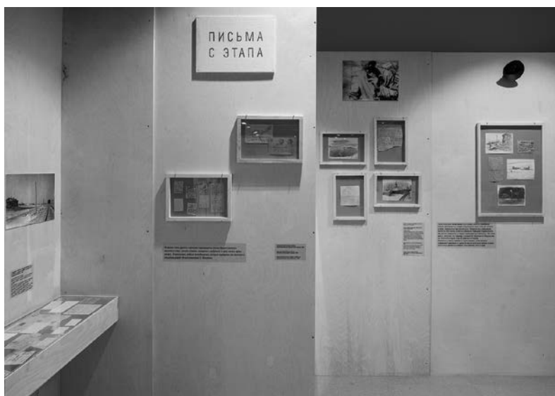
Рис. 2. «Письма с этапа», экспонаты выставки «Право переписки».