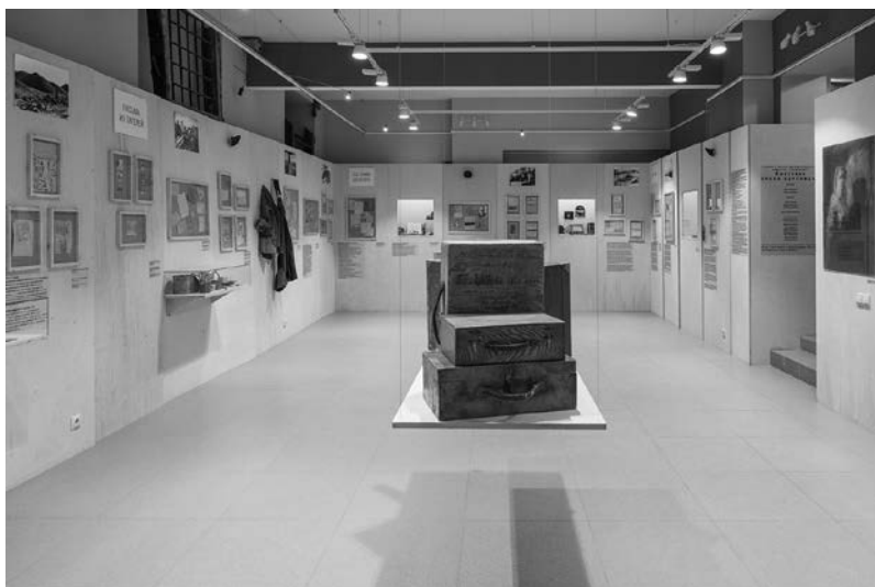
Рис. 7. Интерьер выставки «Право переписки».

В государственных исторических музеях, где также расположены витрины, посвященные сталинским репрессиям, мы, как правило, ходим по большому залу с высокими потолками. Мы получаем информацию о репрессиях, но ощущаем, что сами находимся вне этого. На выставке «Мемориала» в значительно большей степени создается ощущение эмоциональной сопричастности.