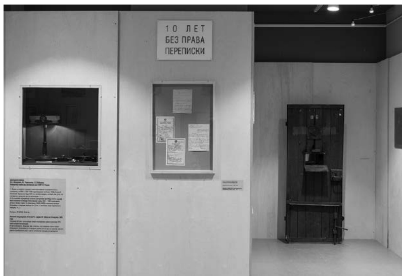
Рис. 4. Экспонаты выставки «Право переписки».

Один из немногих стендов выставки, посвященных документам, которые выдавались учреждениями системы наказаний, посвящен именно этому аспекту – как и на протяжении какого периода система обманывала граждан, распространяя ложные сведения о судьбе их родных. Когда, как и при каких обстоятельствах члены семьи стали получать информацию о том, что их родственников нет в живых? Система с трудом справлялась с огромным количеством запросов, которые начали поступать в НКВД и другие органы, начиная с 1946 года. С этого периода разные инстанции начали выдавать свидетельства о смерти (с ложной причиной и датой смерти). Лишь с конца 1980-х годов начали выдавать новые свидетельства, в которых указывалась истинная причина смерти заключенного. Мы видим на стенде два свидетельства о смерти одного и того же человека. Одно – 1956 года, другое – 1990 года. В первом в качестве причины смерти указана гангрена, во втором – расстрел.