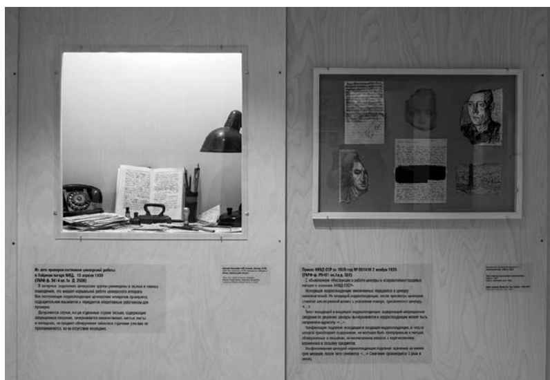
Рис. 6. Экспонаты выставки «Право переписки». Слева – инструменты для работы цензора. Справа – примеры работы цензуры: письма, брошенные в печь цензорами и вытасценные кем-то, а также вымаранные строчки из писем.