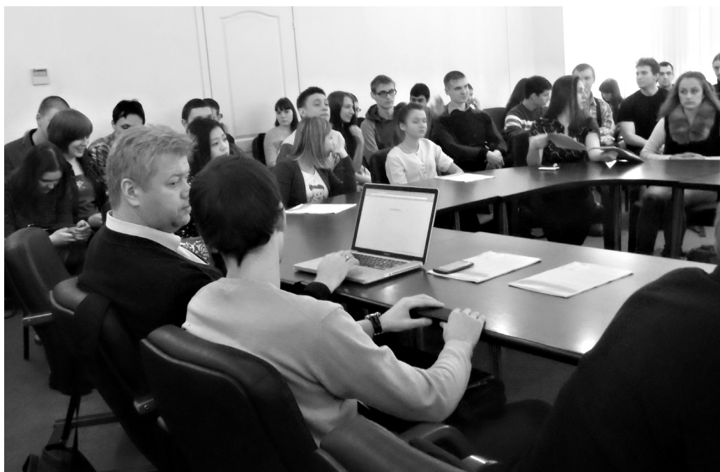
Международный Университет природы, общества и человека «Дубна», 25–26 марта 2013 г.

Лекции прослушали студенты, аспиранты, преподаватели Университета «Дубна», а также гости из Республики Казахстан и Германии. В Казахстанскую делегацию вошли представители Западно-Казахстанского филиала Национальной инженерной академии РК и Казахстанского университета инновационных и телекоммуникационных систем.