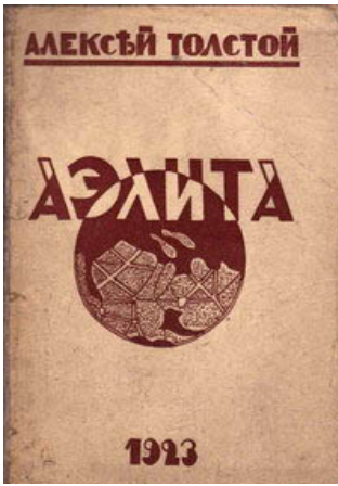
Обложка первого издания романа А. Н. Толстого «Аэлита». 1923

Cover of the first edition of A. N. Tolstoy's Aelita . 1923