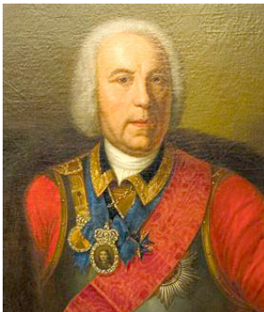
1. Неизвестный художник. Портрет В. де Геннина. XVIII в.

На сегодня возможно полагать установленным, что человек, ставший известным в России как Вилим Иванович Геннин, происходил из незнатной семьи, ряд представителей которой получили известность в XVII в. как деятели просвещения и проповедники в Голландии и в западных германских герцогствах и графствах. Дед В. Геннина Конрад Геннин, получив университетское образование, был священником в Дилленбурге, затем в Зигене, а впоследствии придворным проповедником и инспектором реформатской церкви в Ганау.