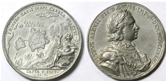
3. Медаль в память о взятии Кексгольма. 1710

И хотя, согласно архивному документу, пожалование «мызы Азила» В. Геннину имело место вовсе не сразу после падения Кексгольма, а в 1714 г. [РГАДА. Ф. 9. Отд. 2. Кн. 48. Л. 468 об.], существа дела это не меняло. Тем более что в 1714 г., вероятнее всего, состоялось уже юридическое оформление пожалования, когда Вилиму Геннину были выданы правоустанавливающие документы.