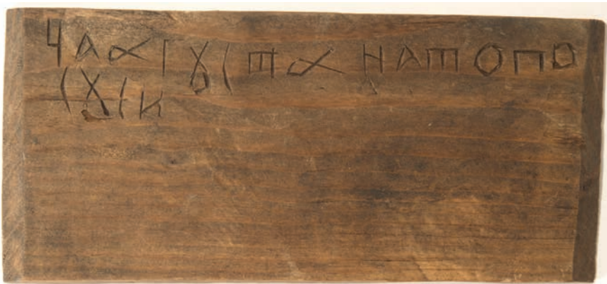
2. Дощечка. Долговая расписка. Коллекция из раскопок Мангазейского городища 2009 г. XVII в. Обратная сторона

Pine tablet. A debt bondage. Collection from the excavations of the Mangazeya settlement in 2009. 17 th century. Front side