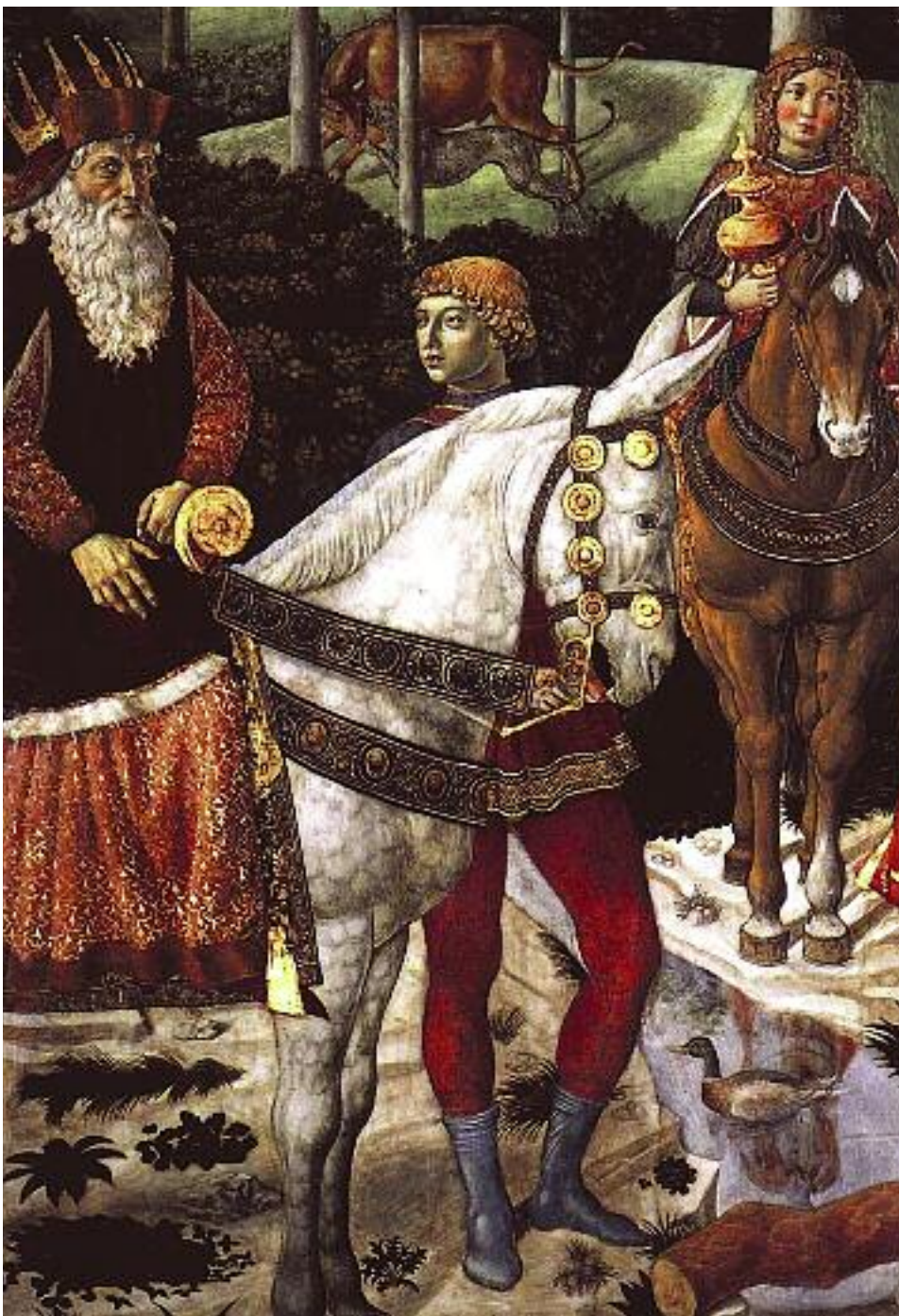
Бенедикто Гочцолли. Шествие волхвов. Деталь: патриарх Иосиф. 1459–1461

В начале работы собора во Флоренции умер константинопольский патриарх Иосиф II, но и этот Божий знак не остановил участников собора. Напротив, смерть одного из главных действующих лиц собора только ускорила подписание унии.