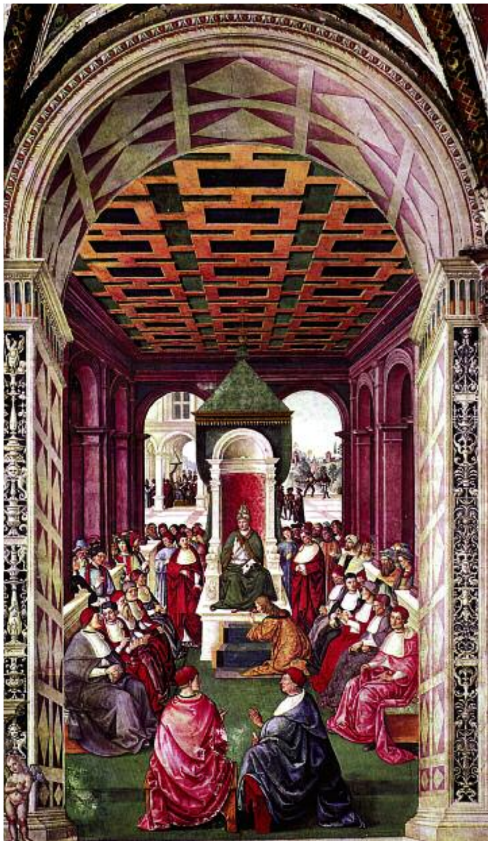
Пинтуриккио. Двор папы Евгения IV. 1502–1503

Среди активных участников собора был и русский митрополит — грек Исидор. На соборе митрополит Исидор вопреки воле великого князя Московского выступал одним из самых активных сторонников унии с католиками и за свое усердие был возведен папой Евгением IV в кардиналы.