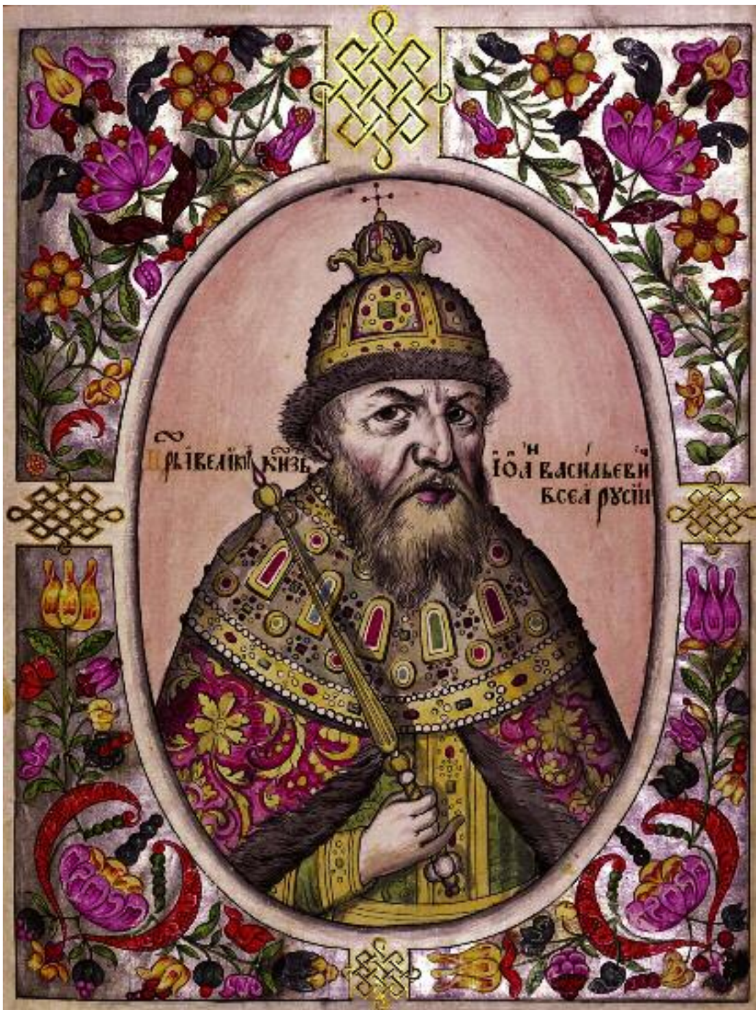
Иван IV. Начало XVII века

Алексеевич счел необходимым подчеркнуть, что его реформы были направлены на то, чтобы «с нами не стало как с империей Греческой». Эти слова можно понять не только как объяснение сути тех реформ и действий, которые проводил великий русский государь-преобразователь (а отношение к петровским реформам было и остается противоречивым), но и как нарочитое свидетельство гео-