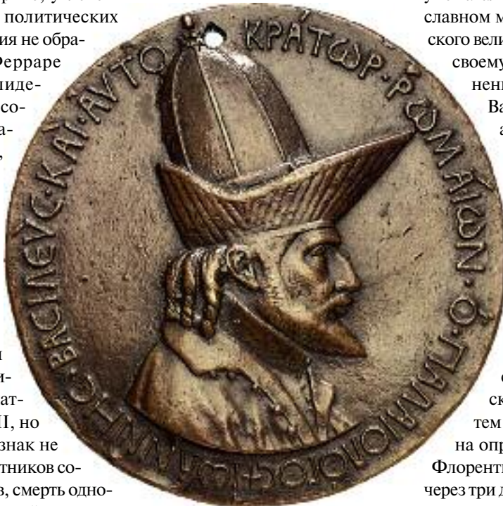
Пизанелло. Иоанн VIII Палеолог. Памятная медаль. 1438

активного участника политической борьбы в Константинополе. И этот человек, незадолго до того возведенный на московскую кафедру — как полагают, специально, чтобы он мог принять участие в соборе, — стал одним из самых активных пропагандистов унии с католиками. Приехав в