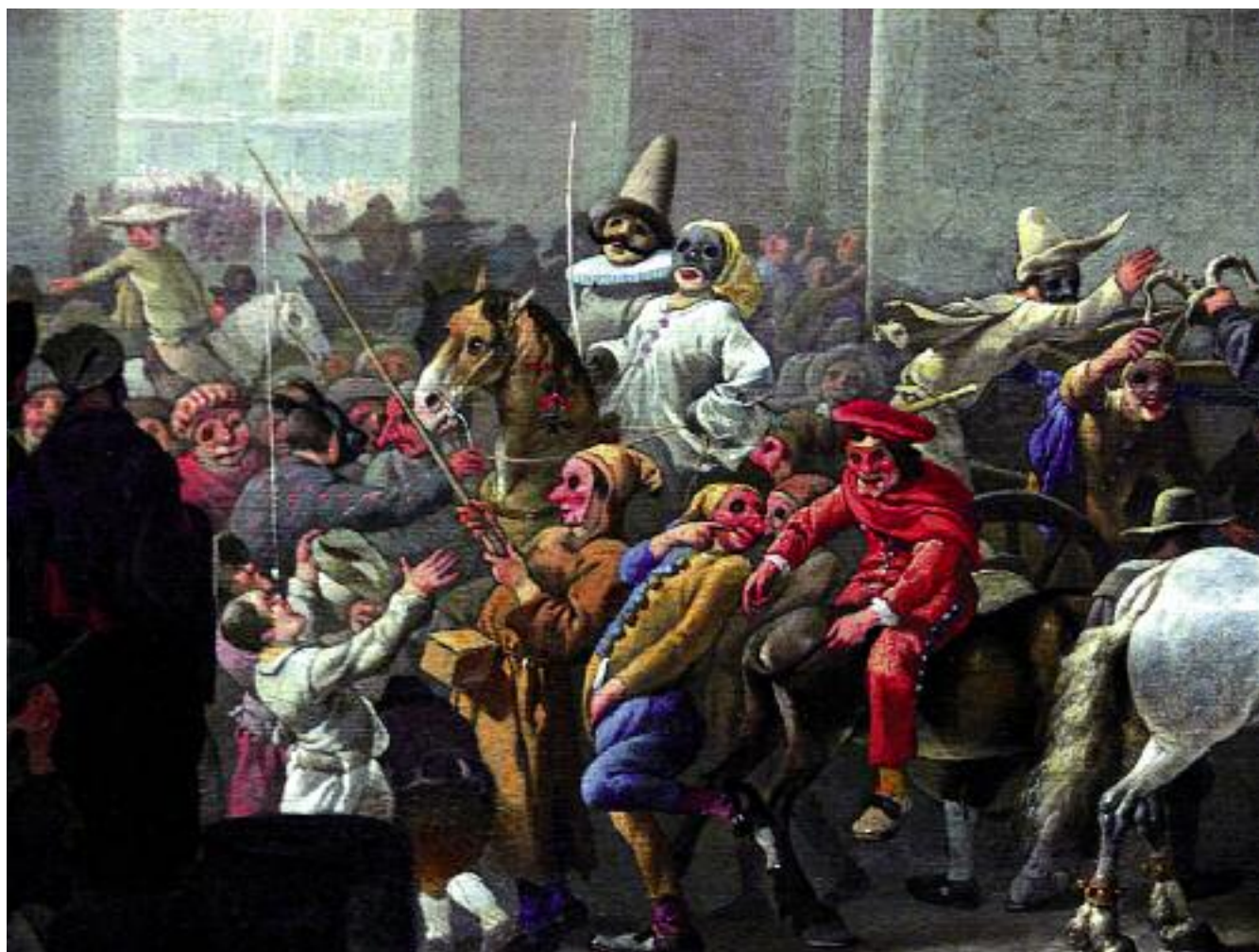
Иоганн Лингельбах. Карнавал. Около 1650/1651 годов

будет меня уничтожать. Так что либералов и неолибералов у нас во властной элите никогда и не было: все до одного использовали только инструменты государственного регулирования, а вовсе не свободной рыночной конкуренции — начиная от гайдаровской революции сверху, до чиновников-коррупционеров, формирующих уже второе — наследственное — поколение в России.