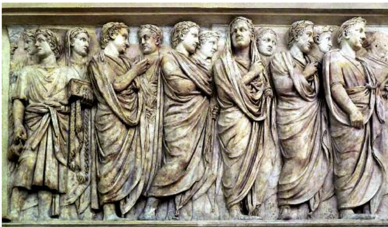
Барельеф с Алтаря мира. I век

ценностями (личностными, социальными и пр.)? Что первично, что вторично? Какова природа ценностей? Какова палитра ценностей современного российского общества? Существует ли конфликт ценностей? Как он может быть (и может ли быть) разрешен?