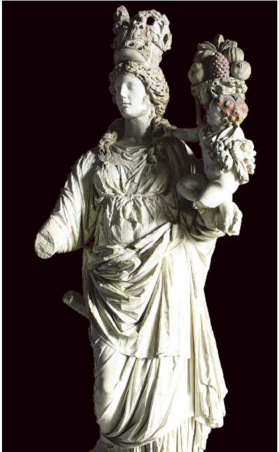
Античная статуя, изображающая Судьбу

Говоря об идеологической палитре современной России, следует признать наличие множества идеологий, присущих разным социальным группам. Немногие из них оформлены в политические программы и обладают институциональными формами — структурами, производящими, развивающими и распространяющими идеологические доктрины. При этом требование Конституции об отсутствии господствующей идеологии формально соблюдено: нет единого государственного органа, производящего, манифестирующего общегосударственную идеологию и контролирующего ее внедрение в жизнь — наподобие того, как в свое время делали аппарат ЦК КПСС, партийные органы и контролируемые ими СМИ. Или же в той форме, в какой сейчас осуществляется идеологическое доминирование в США — посредством документов типа «Патриотического акта 2001 года», а также разработанных государственными институтами «Стра-