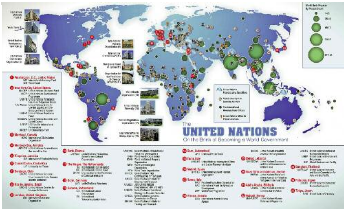
Карта учреждений, проектов и миссий ООН

Под эгидой ООН сложилась и эффективно действует система специализированных международных учреждений, решения которых во многих случаях признаются всеми странами как имеющие обязательный характер.