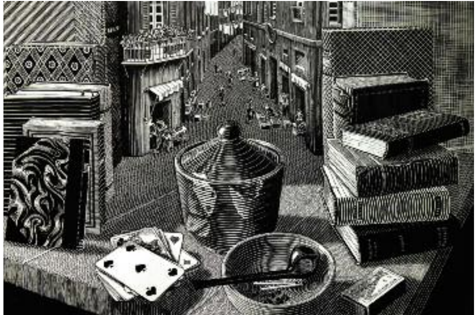
Мауриц Эшер. Натюрморт и улица. 1937 год

Люди бывают общительными и замкнутыми, экстравертами и интровертами. В каждом человеке и в обществе в целом сосуществуют эти два психотипа одновременно, но чаще всего один из них является доминантным. Выбирается и соответствующая линия поведения. Жизнь народа на протяжении столетий отбирает то сочетание линий поведения, которое наилучшим образом способствует выживанию и процветанию народа, сохранению его этических, духовных ценностей, осознаваемому народом историческому предназначению. В каждом обществе сосуществуют две тенденции – самоутверждение и интеграция. Они не являются абсолютно непримиримыми, смертельно борющимися. В гармоничном обществе их борьба является диалектическим источником развития, но при условии наличия третьего – этического – фактора: христианское понимание мировой гармонии в ее высшей форме, в форме «неслиянного единства», символизируется в образе Святой Троицы. Человек же, ведомый своими побуждениями, разрушает эту гармонию, следуя, например, самоутверждению в непозволительно более высокой степени, нежели интеграции, «приспособив» под эти действия и собственную гибкую мораль. Поучительно сравнить самоутверждение и интегра-