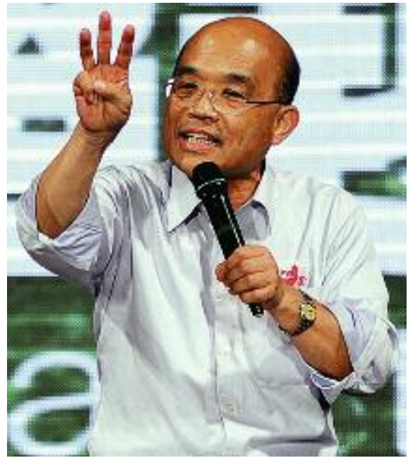
Действующий председатель ДПП Су Цзэнчан

идентичности, самому по себе довольно болезненному. В случае Тайваня волевым «учреждением» нации затрудняется еще целым рядом факторов. Тайвань, как известно, населен иммигрантами, изначально живущими в полиэтничном обществе. Само по себе это обстоятельство не кажется непреодолимым препятствием для создания национального государства. Идеологи ДПП часто ссылаются на опыт США, Канады, Австралии, Новой Зеландии и других государств, созданных переселенцами, как на вдохновляющий пример для Тайваня. Это сравнение не совсем корректно. Сомнительно, чтобы Кана-