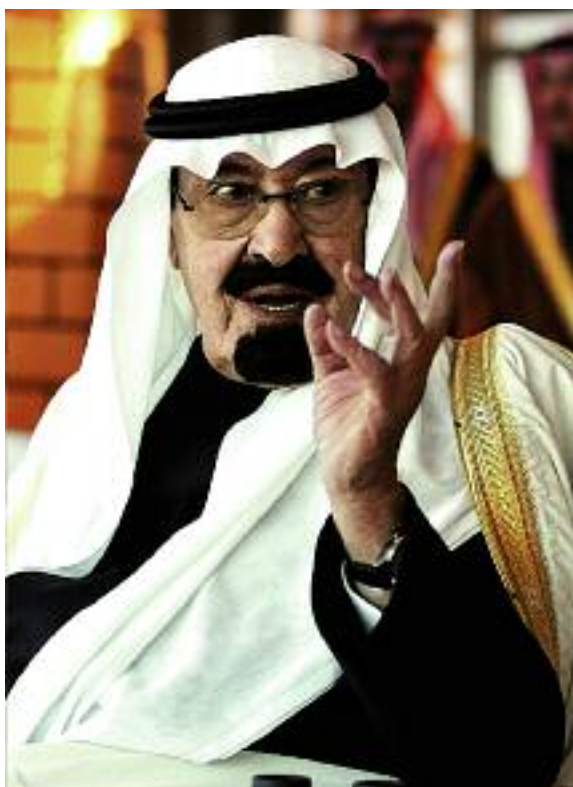
Король Абдалла ибн Абдель Азиз Аль Сауд

Саудовская Аравия занимает влиятельную позицию в Организации исламского сотрудничества как некий центр тяжести, консолидирующий вокруг себя исламский мир, что с момента основания Саудовского государства являлось отличительной чертой проводимой им внешней политики.