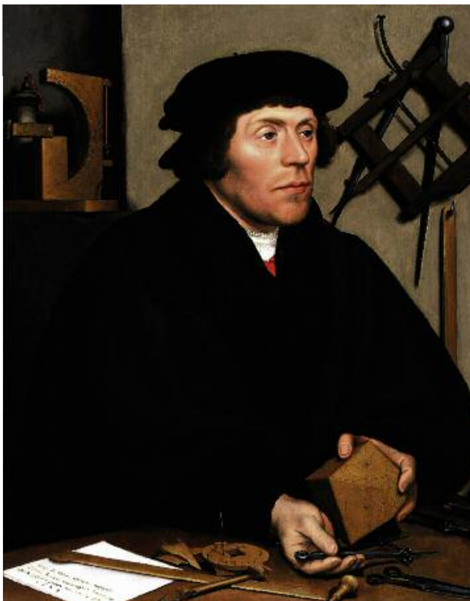
Ганс Гольбейн Младший. Портрет гуманиста. 1528 год

Новый гуманизм требует переосмысления фундаментальных основ политики – прежде всего под углом зрения ее соотношения с моралью. Вместо противопоставления политической этики ответственности нравственной этике убеждения должна быть найдена формула их оптимального сопряжения в рамках единого гуманистического алгоритма.