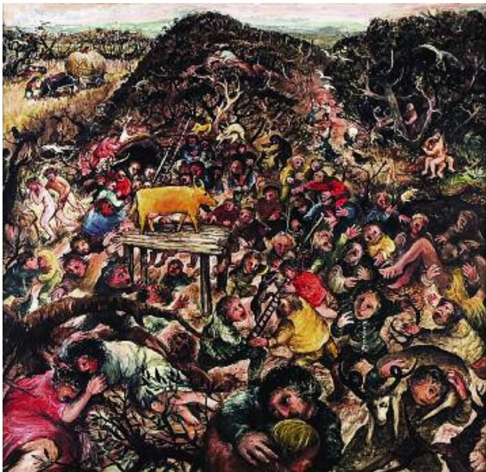
Артур Бойд. Золотой тельец. 1995 год

На заре эпохи индустриализма, когда в нарождавшихся капиталистических отношениях обнаружились антигуманные проявления, возник-