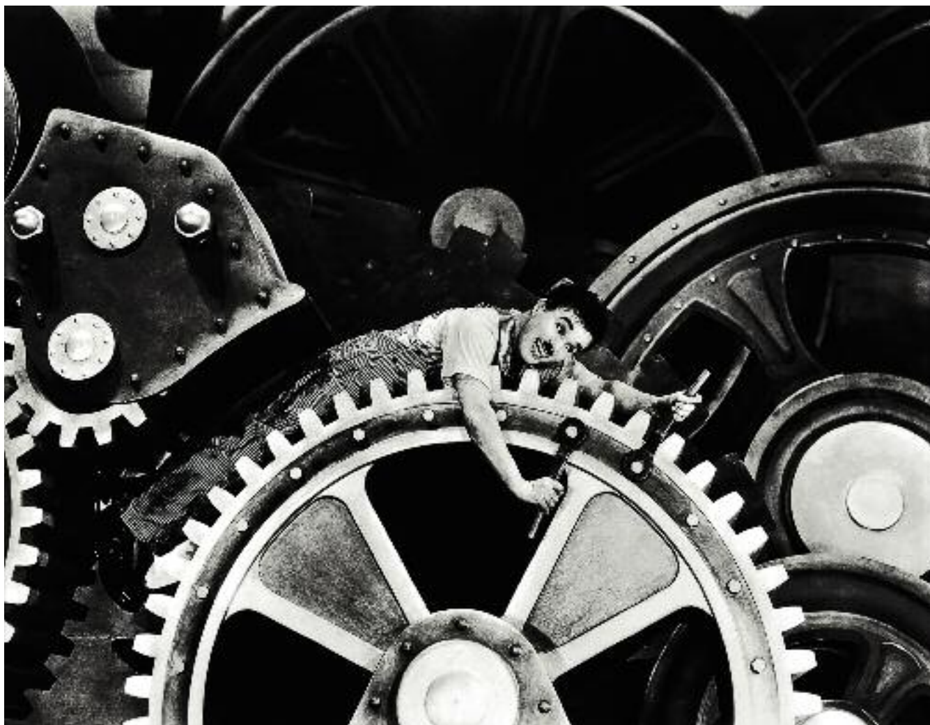
Кадр из фильма Чарли Чаплина «Новые времена». 1936 год

было скованно цепями жесткой зависимости (вплоть до физического выживания) от природной среды, от материальных предметов и орудий труда. Можно сказать, что вся предистория человечества есть время мучительного высвобождения homo sapiens из природного пленения, сдерживавшего раскрытие и развитие креативного потенциала человека и человечества и тем самым одновременно побуждавшего двигаться в этом направлении.