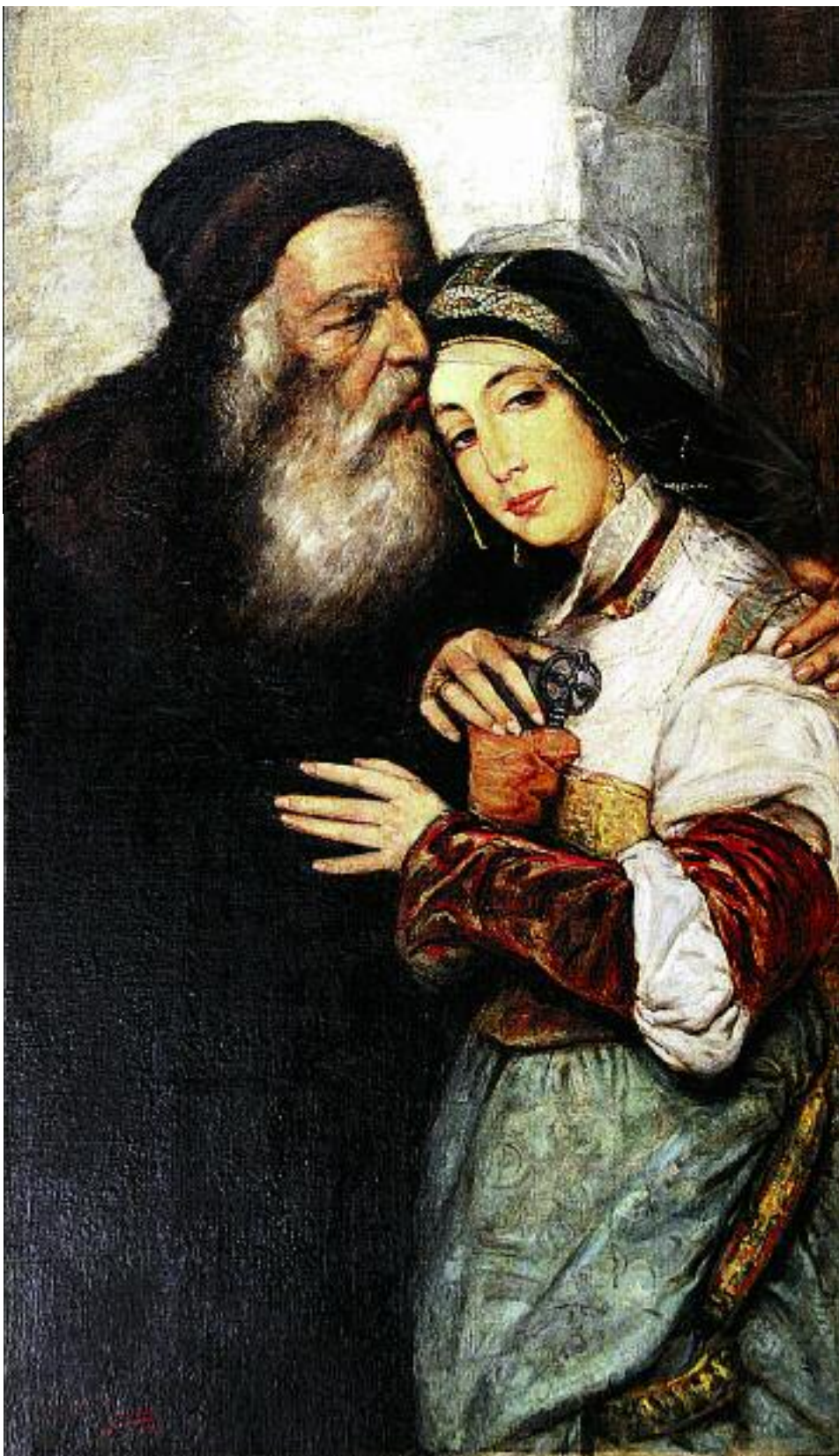
Мауриций Готтлиб. Шейлок и Джессика, «Венецианский купец». 1887 год

В постперестроечный период Россия движется по вязкой колее обесчеловеченного прагматизма всеобщей коммерциализации. Человек, не замкнутый на мотивацию выгоды, по логике доморощенных рыночных фундаменталистов превращается в тяжкое «обременение» экономики, подрывающее ее эффективность.