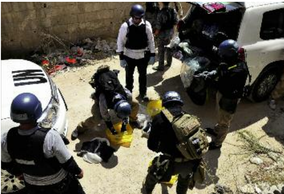
Уничтожение оборудования для производства химического оружия в Сирии

Россия договорилась и решила проблему химического оружия в Сирии. Этого обоснования для вторжения в Сирию больше не существует. Так нет же, все равно Америка не отказывается от намерения наказать Асада.