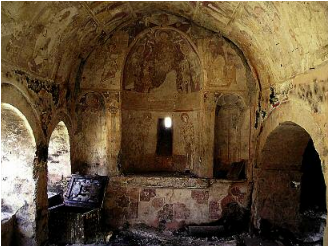
Оскверненный храм в Косове

предложил призывать женщин в армию. И, кстати, как Вы думаете, кто первым приписал мне эту несурезицу? Навальный! Больше года назад в своем твиттере он написал, что Милонов хочет женщин, не родивших до 23-х лет ребенка, брать в армию. А потом уже пошло-поехало. Против меня в сетях развернулась настоящая война. Я-то спокойно к этому отношусь, и мне даже интересно все это наблюдать. Но вместе с тем, конечно, не может не тревожить то, что мы позволяем нашим врагам так свободно и открыто орудовать на нашей территории. Почему у нас социальные сети превратились в откровенный рупор антигосударственных, антироссийских сил? Я попытался призвать к ответственности владельцев этих публичных сообществ в Интернете. Они, естественно, тут же все исказили, сказали, что я против шуток в Интернете. Ну, да бог с ними. Они-то четко понимают, на что я покушаюсь. Я поку-