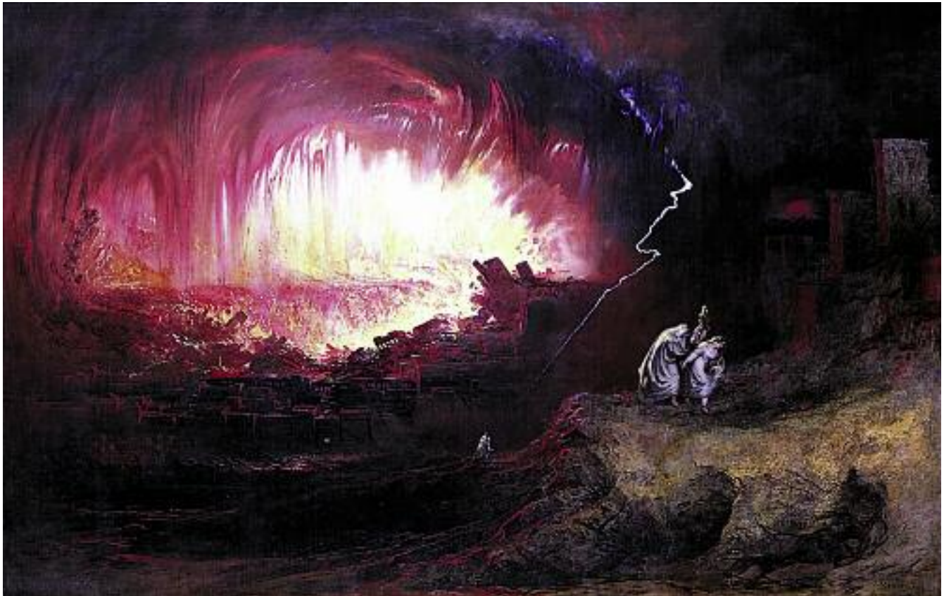
Джон Мартин. Разрушение Содома и Гоморры. 1852 год

ствие ее пересечения с цивилизацией Содома, хотя и иначе, чем в случае с трагической историей Капетингов. Последний представитель династии Валуа — король Генрих III — являлся по свидетельству современников тайным гомосексуалистом. Эта личность ярко описана Александром Дюма-отцом в романах «Графиня де Монсоро» и «Сорок пять». Конец XVI века во Франции ознаменовался противостоянием католиков и радикальных протестантов-гугенотов, часто открыто заявлявших о своей по меньшей мере политической, а иногда и духовной преемственности с еретиками-катарами. Король Генрих III, являвшейся официально патроном и защитником католиков, отказался предоставить своим братьям-католикам политическую поддержку и объявить тотальную войну еретикам-протестантам. Вместо этого он окружил себя молодыми смазливими француз-