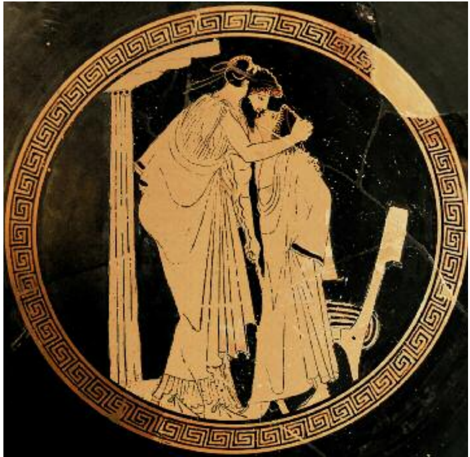
Мастер Брисейды. Около 480 года до н.э.

После 17 мая 1990 г. законодательные органы западных государств пережили настоящий бум принятия законопроектов, разработанных гомосексуальным лобби соответствующих стран и направленных на постепенное придание однополым союзам все более высокого официального статуса. Конечной целью этого процесса было полное уравнивание их прав с правами гетеросексуальных пар. Дело шло к признанию на государственном уровне однополых браков. В начале данного процесса, имевшего место в 90-е годы прошлого века, органы законодательной власти многих европейских государств, а также некоторых штатов США, Канады и Австралии приняли законопроекты о регистрируемом, или гражданском, партнерстве. Подобное решение стало последним этапом перед признанием однополых браков соответствующими государствами. Статус официально регистрируемого партнерства давал лицам, его заключившим, практически равные права с традиционными браками. Де-факто отличия прав лиц гомосексуального