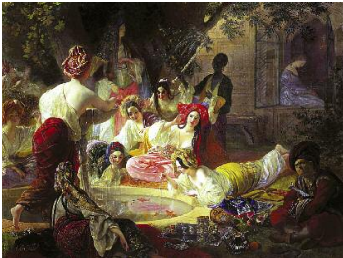
Карл Брюллов. Бахчисарайский фонтан. 1849 год

Высшим выражением политической субъектности Крыма стало Крымское ханство. Хотя оно находилось в формальной зависимости от Османской империи, силовые линии по осям Бахчисарай–Варшава–Москва были определяющими в системе международных отношений XV–XVIII веков, заложив фундамент пресловутого «изобретения Восточной Европы».