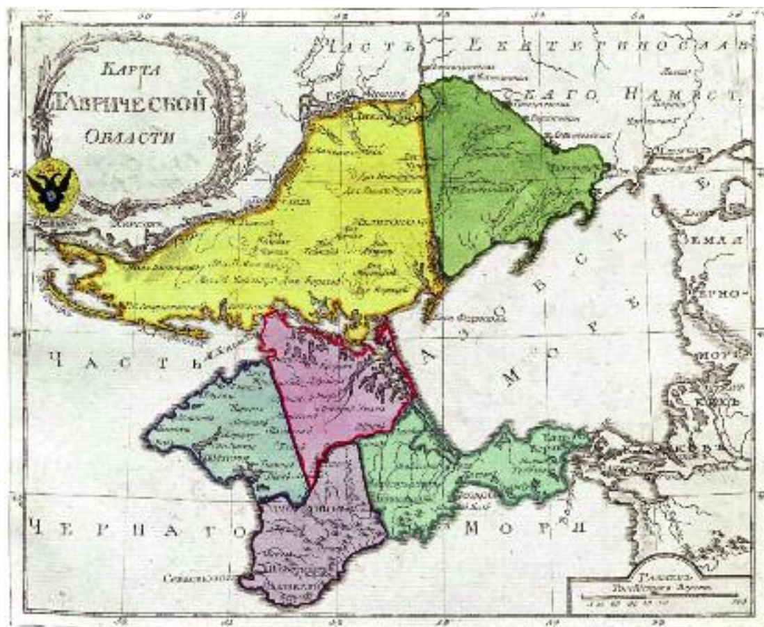
Карта Таврической области. 1792 год