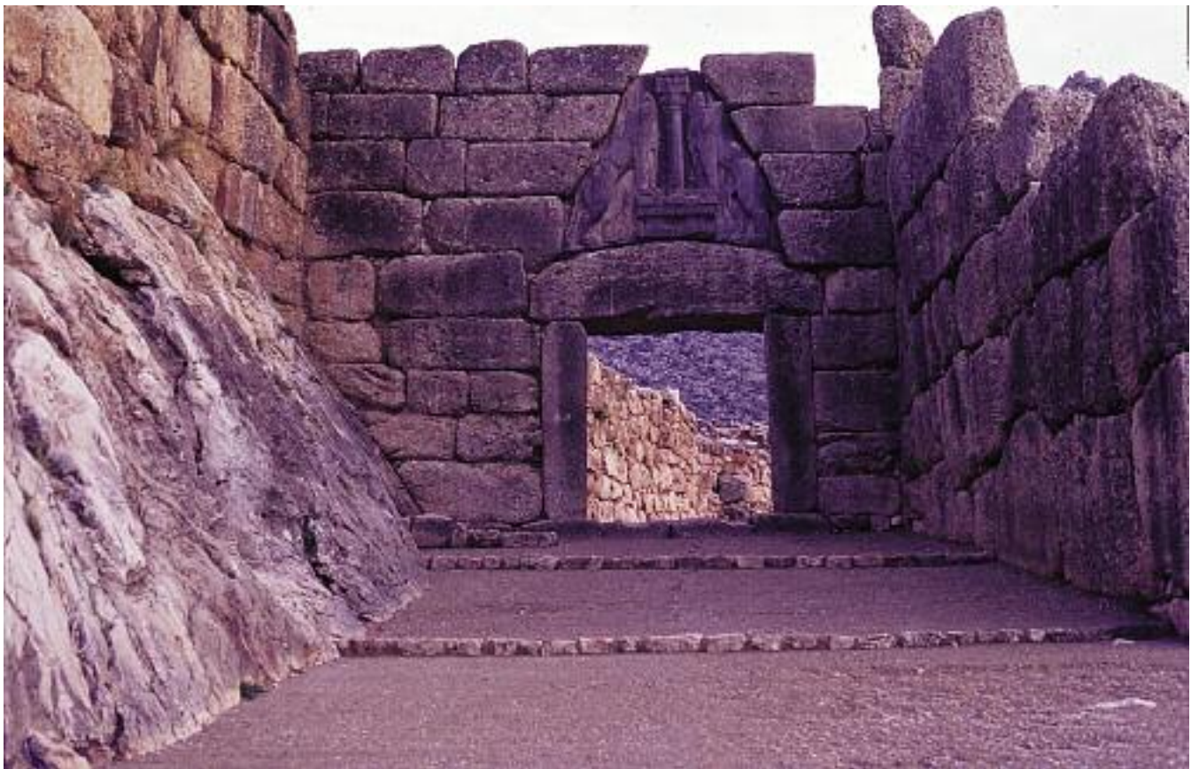
Львиные ворота Микен

эпох и культурных миров соборная Ойкумена подвергается теперь трансгрессии и вивисекции со стороны новых варваров Севера и Юга. Национальные государства утрачивают привычную актуальность, их суверенность изменяется под влиянием глобализации, глокализации, субсидиарности, новых формул политического единения. Прагматичный же консенсус былого и будущего — региональные и геоэкономические интеграции, по-своему перемалывающие состояния и границы прежних обществ.