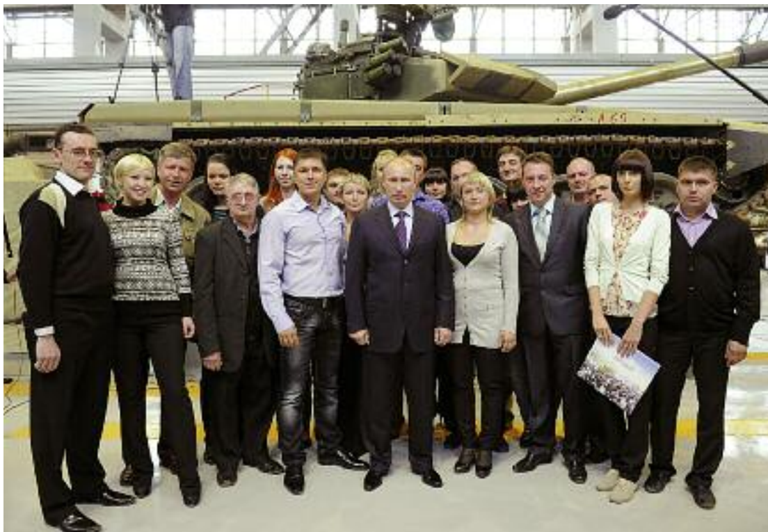
Владимир Путин на Уралвагонзаводе