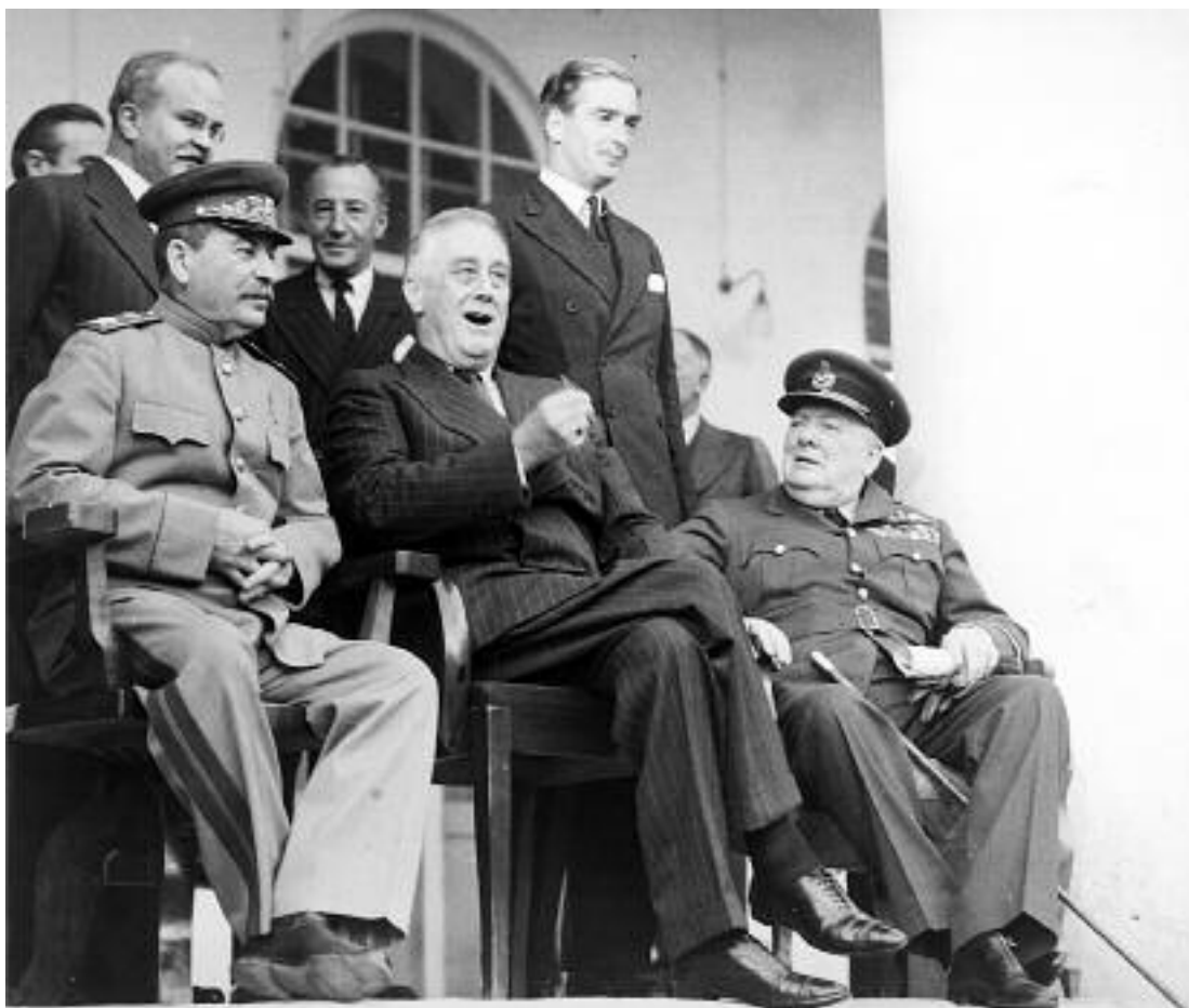
Сталин, Рузвельт и Черчилль на Тегеранской конференции

В эпоху «Большой тройки» всё-таки очень многое еще зависело от личного фактора – от того, какие фигуры находились на первых ролях в главных странах по обе стороны фронтов Второй мировой. Современная большая политика безлика. Электоральная рутина порождает всё меньше и меньше политических гениев.