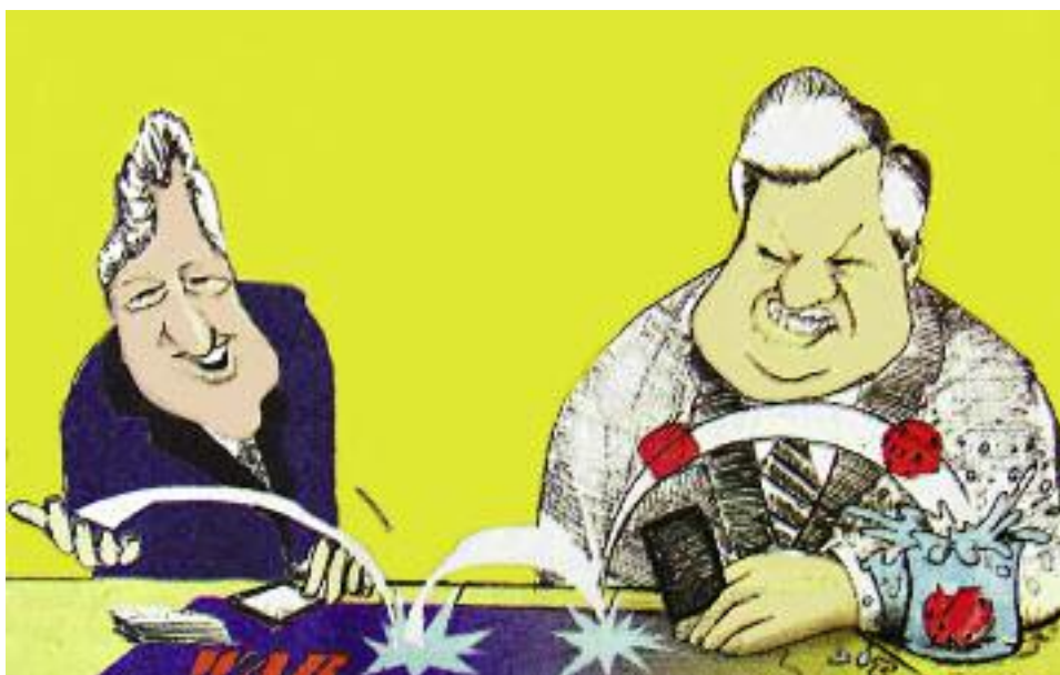
Карикатура на Билла Клинтона и Бориса Ельцина