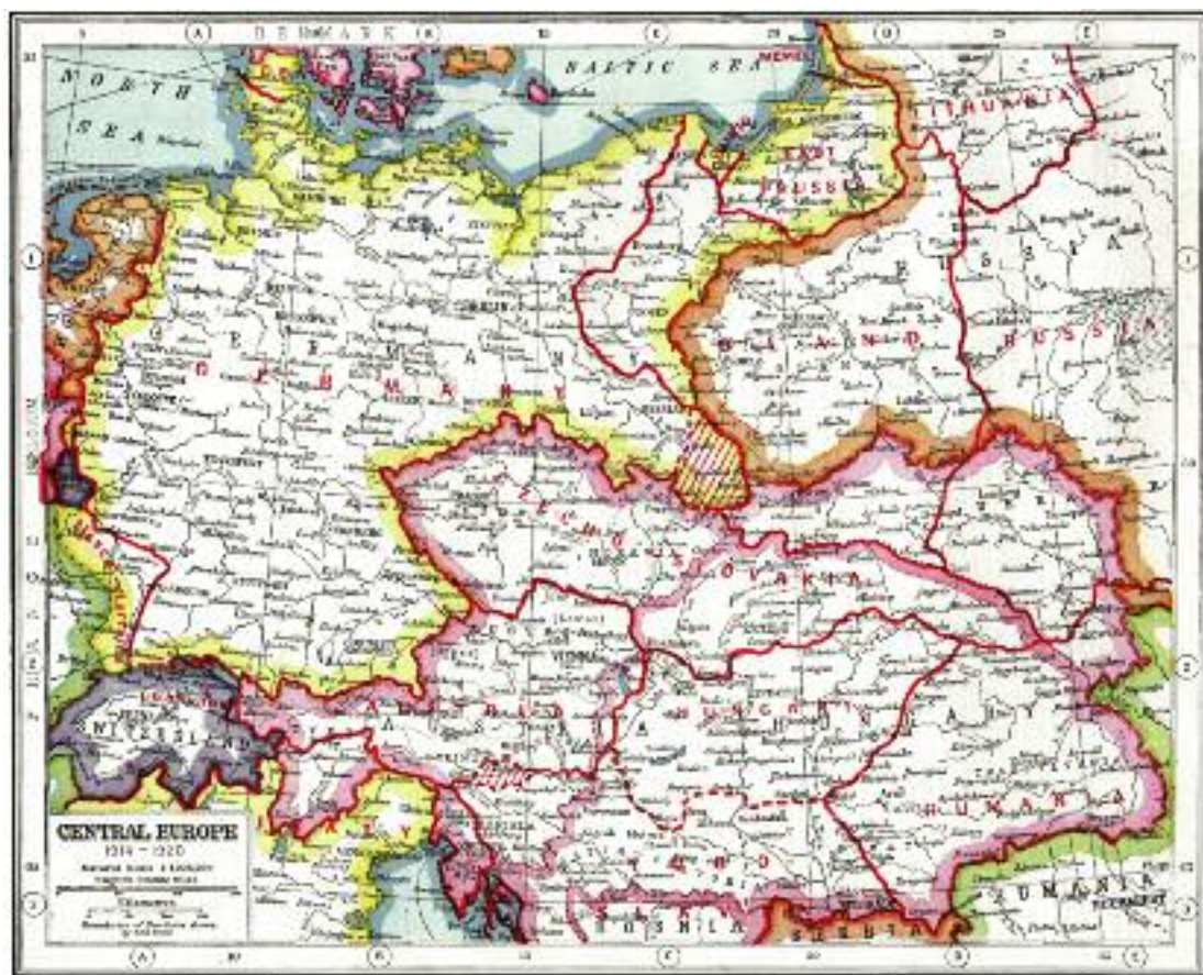
Карта Центральной Европы. 1914–1920 годы

торая скорее всего распадётся, и за Балканы примет на себя Российская империя. Югославия и Чехословакия в конечном счёте были реализацией давних геополитических панславистских проектов русских царей. Предполагалось, что три новых больших славянских государства, которые планировалось создать после войны, — Польша, Чехословакия и Югославия — будут в той или иной степени находиться под российским протекторатом. Новая Польша, которая должна была включать этнические польские территории из состава Австрии, Пруссии и России, вообще мыслилась автономной частью Российской империи — примерно на тех же правах, на каких существовало Царство Польское в 1815–1830 годах. Чехословакия и Югославия в обеспечении своей безопасности должны были бы полагаться прежде всего на Россию. В условиях сохранения сильной Россий-