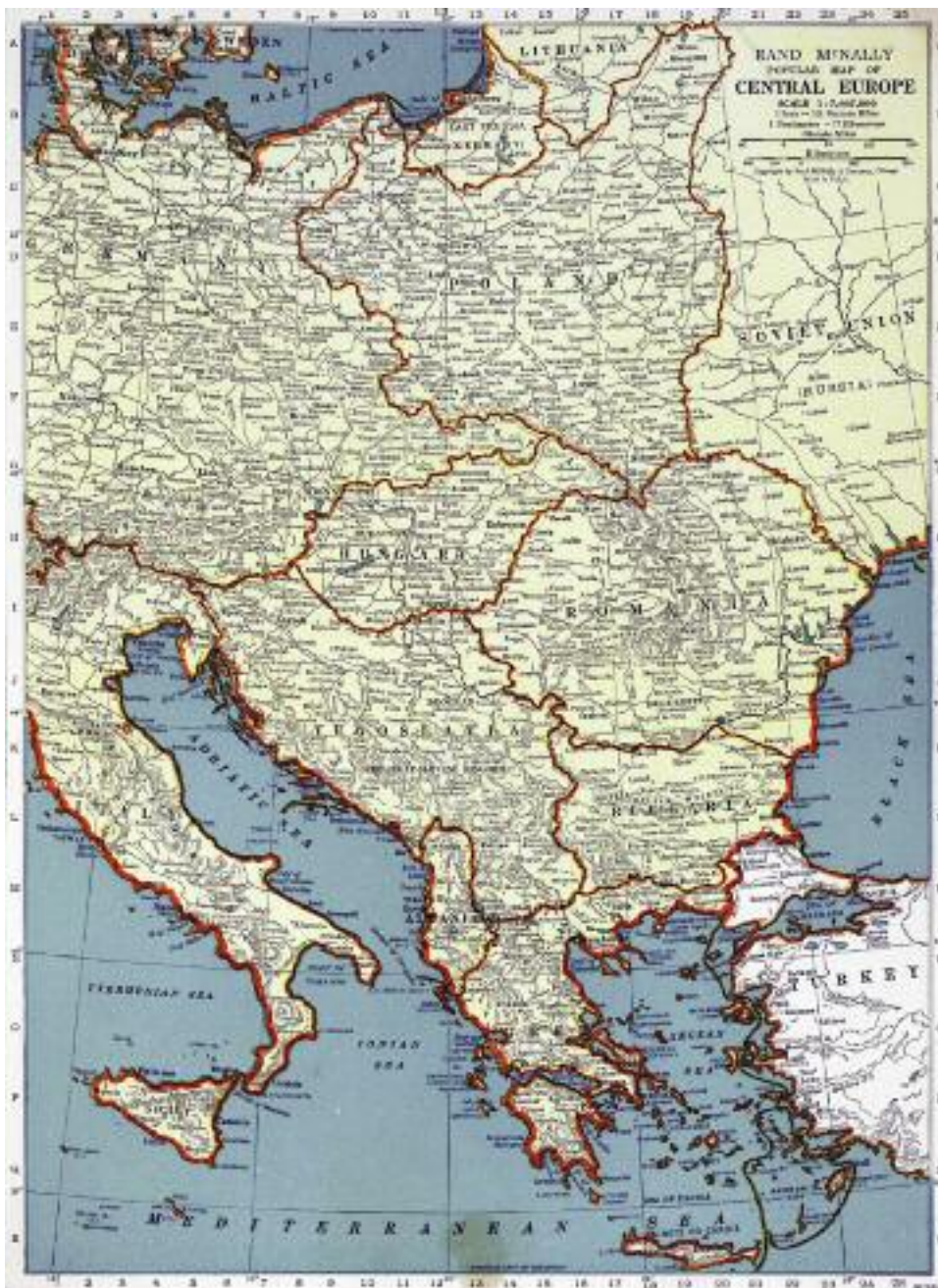
Карта Центральной Европы. 1939 год

стал печальной новинкой, которую принесла Первая мировая война. Прежде контрибуции, как бы ни был велик их размер, все-таки не преследовали своей целью установление контроля победителей над экономикой побежденных, что, естественно, сильнейшим образом ограничивало суверенитет последних.