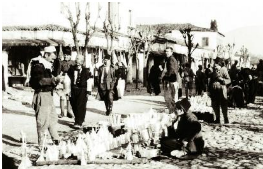
Центральная улица Тираны в первой четверти XX века

гласил стать капитана прусской армии, родственника германского кайзера Вильгельма II и племянника румынской королевы Елизаветы Вильгельма Вида. 7 марта 1914 года принц с супругой прибыли в Дуррес на австрийском военном корабле. Однако Вильгельму Виду не удалось справиться с царившей в Албании анархией, и всего через месяц после начала Первой мировой войны, 3 сентября 1914 года, князь отбыл в Германию, признав крах своих усилий, хотя и не отрекся от престола. За влияние в Албании вели между собой борьбу Австро-Венгрия, Италия, Сербия, Черногория и Греция. Последняя претендовала на Южную Албанию, где проживало значительное греческое меньшинство.