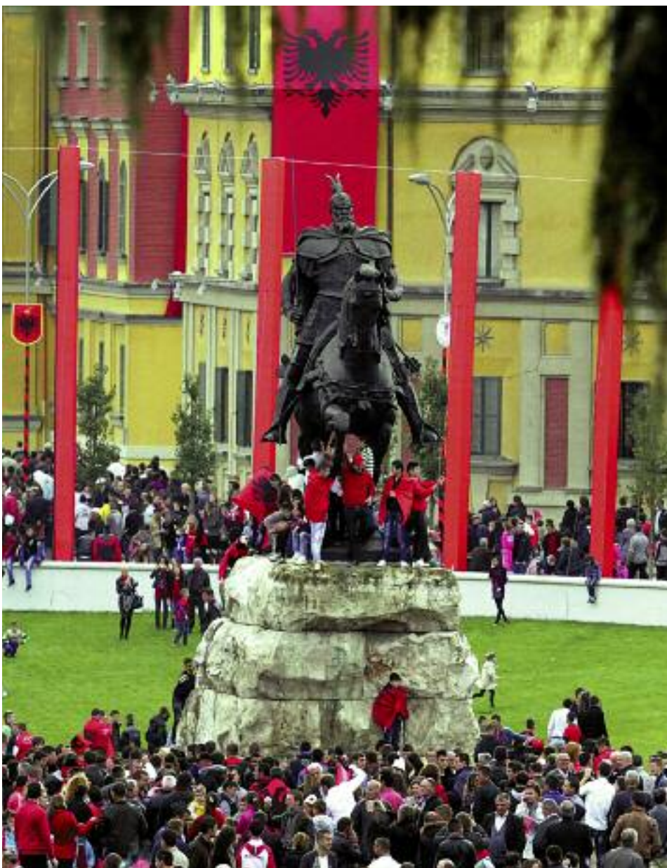
Одисе Паскали. Памятник Скандербегу (1968 год) в Тиране на фоне знамени Скандербега – национального флага Албании

автономного развития». При этом «Дарданеллы должны быть постоянно открыты для свободного прохода судов и торговли всех наций под международными гарантиями». На деле «Четырнадцать пунктов» означали, что от Дунайской монархии останутся только Австрия и Венгрия в своих этнических границах, причем только как отдельные государства, не объединенные в какую-либо федерацию или конфедерацию. От Османской же империи должны были остаться лишь этнически турецкие (тюркские) территории. Реально новое турецкое