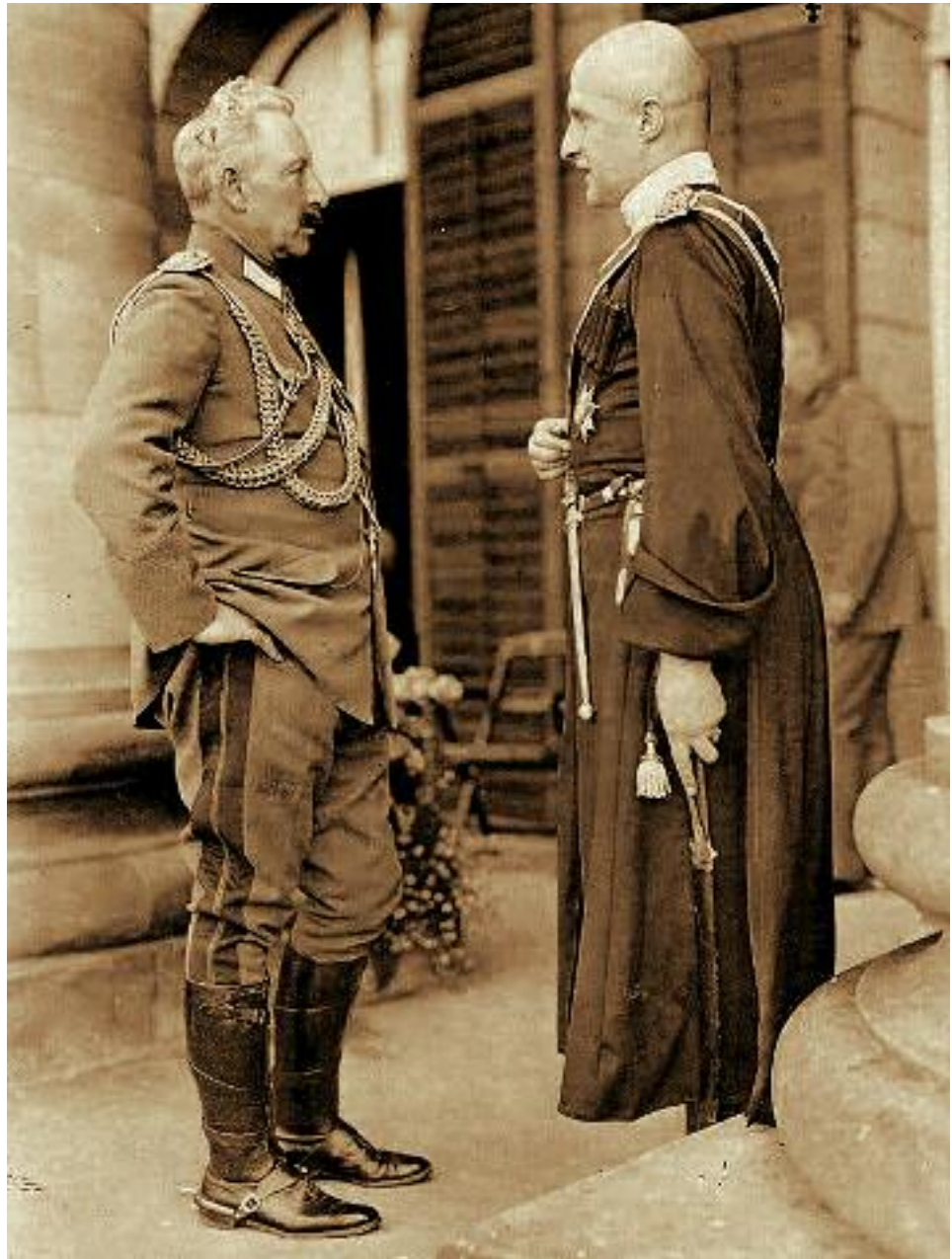
Кайзер Вильгельм и гетман Скоропадский в августе 1918 года

немаловажную роль сыграло то обстоятельство, что главными противниками чехов всегда были немцы, а словаков — венгры, так что между собой эти два народа почти никогда не враждовали. В то же время фактически до 1918 года Чехия и Словакия находились в составе двух разных и во многом различных государств — соответственно Австрии и Венгрии. Это ощущалось и до официального создания в 1867 году двуединой австро-венгерской монархии, поскольку и ранее Чехия все равно была частью Австрии, а Словакия —