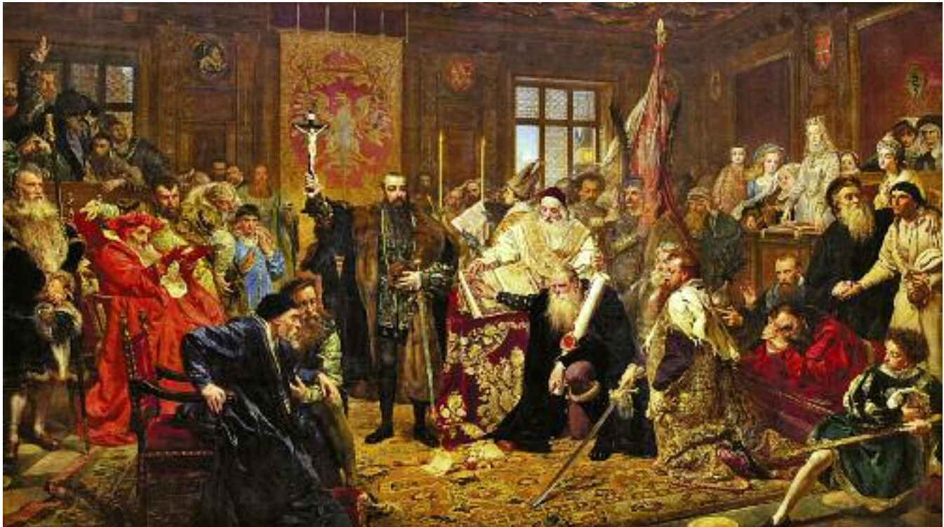
Ян Матейко. Люблинская уния. 1869 год

туса Великого княжества Литовского. Таким образом, территория Западной Руси, первично потеряв свой государственный суверенитет в середине XIV века, став частью Великого княжества Литовского, затем уже вторично утратила его в середине XVI века в результате присоединения своего нового государства к чужому государству — Королевству Польскому. Это событие резко ухудшило политический, правовой и социальный статус русского населения бывшей Западной Руси. В Речи Посполитой оно подверглось жестокой дискриминации по национальному и религиозному признакам со стороны своих новых господ — польской шляхты, — от произвола и гнета которых их бывшее «родное» государство — Великое княжество Литовское — вследствие потери государственного суверенитета более не могло защищать своих бывших подданных. Народ в Московском царстве периода Смуты видел, в каком тяжелом положении находилось русское население Речи Посполи-