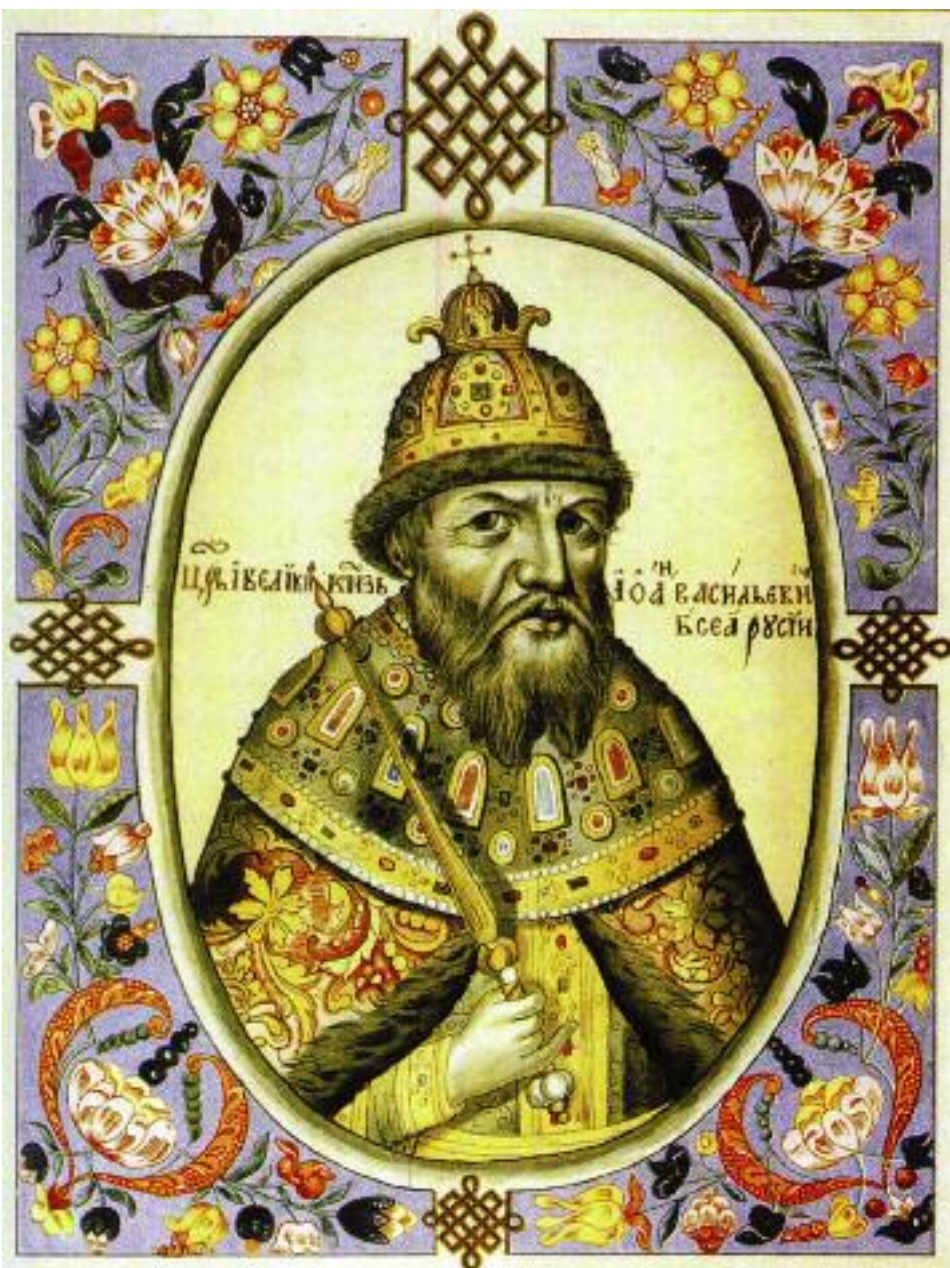
Иван IV из «Царского титулярника», 1672 год