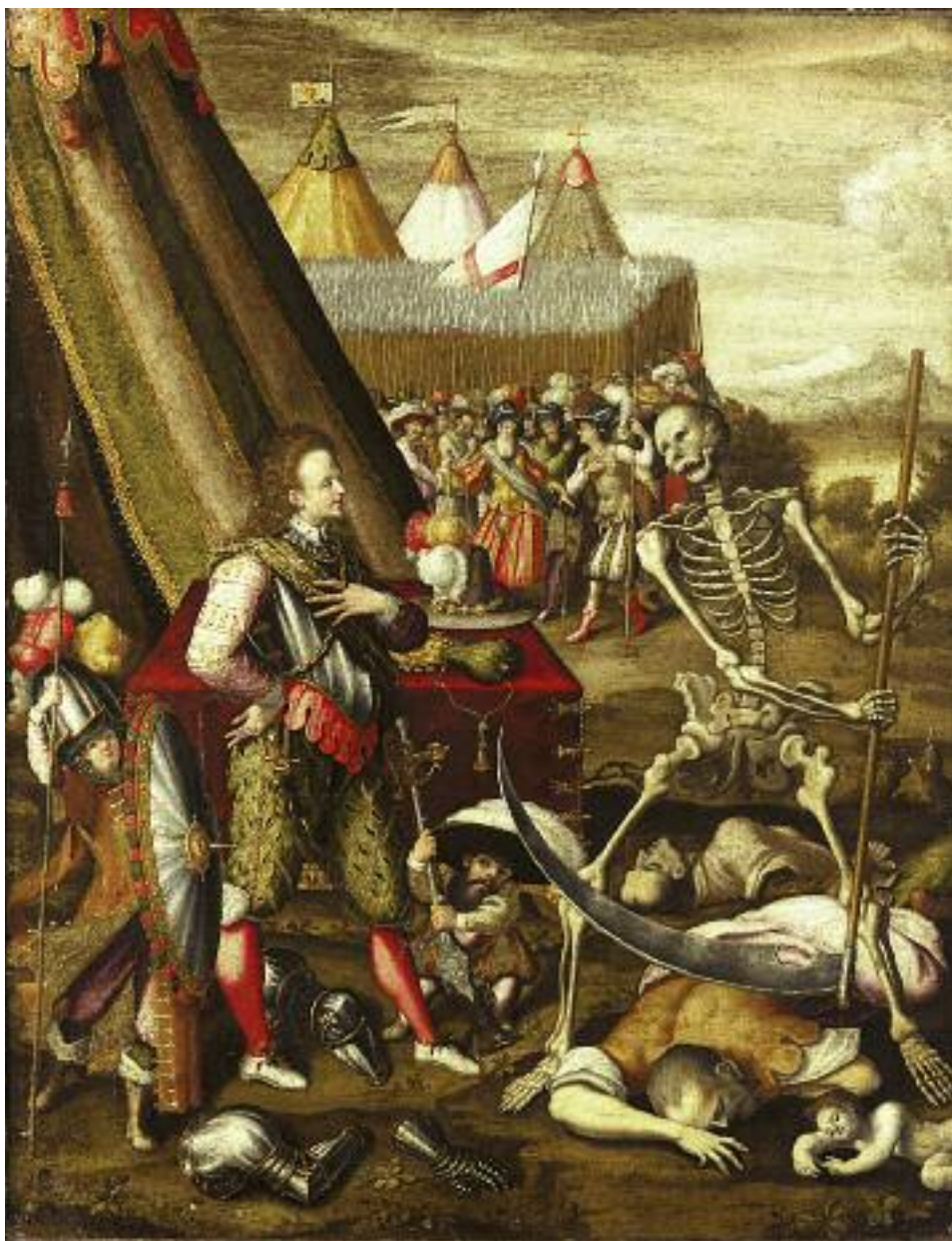
Антуан Карон. Аллегория войны. XVI век