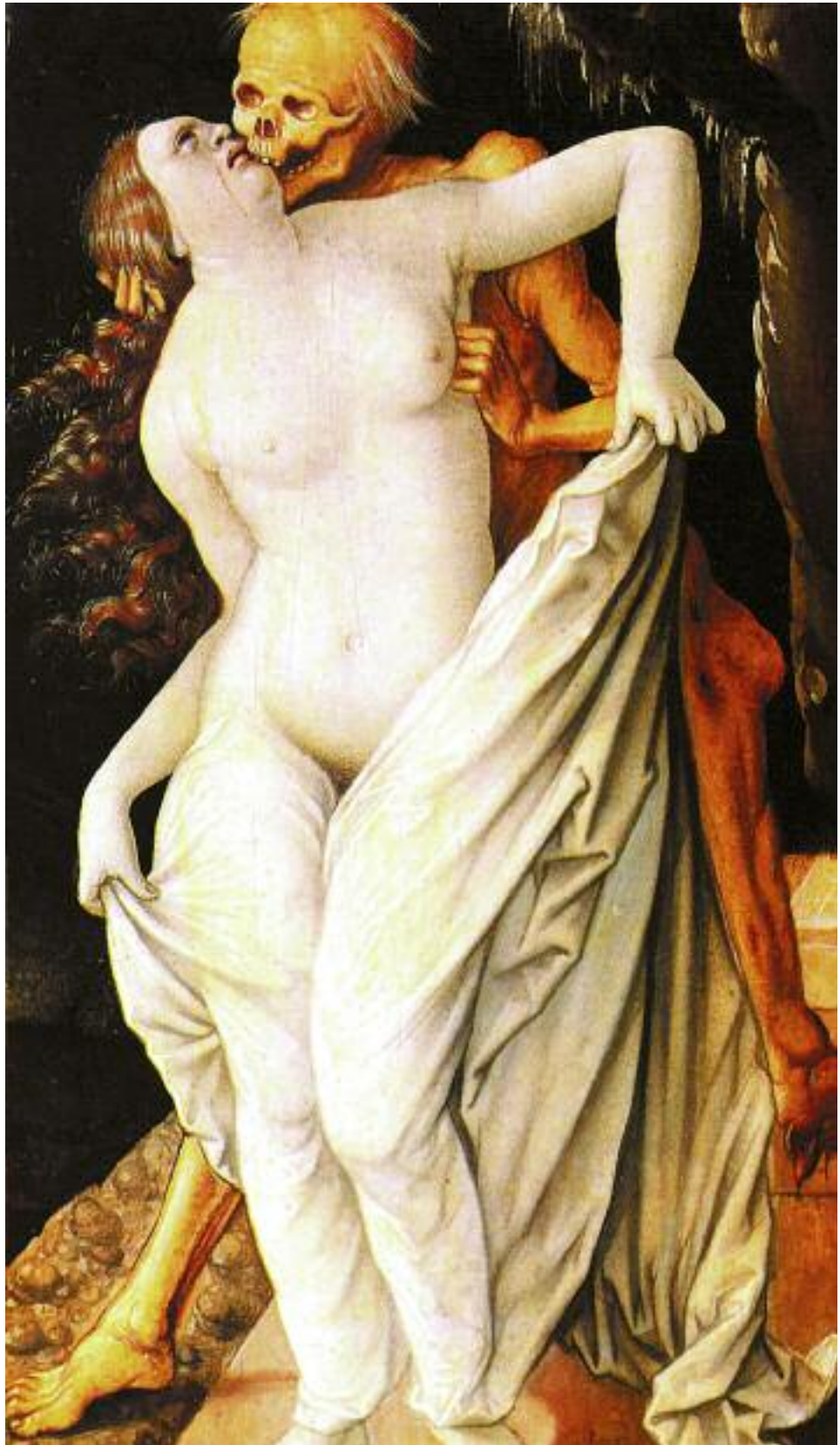
Ганс Бальдунг. Смерть и женщина. 1520 год

Лоно мрачной страсти — ярость глобальных фавел и бидонвелей, суммы нищеты и междоусобиц, презрения к достоинству человека, некогда познанному и признанному цивилизацией. Взрывчатая смесь экстремизма и нигилизма насыщается испарениями из метафизических областей, нетрадиционных практик и традиционных источников. Складывается порода людей, лишенных былой культурной идентификации, а бурлящая природа их страсти —