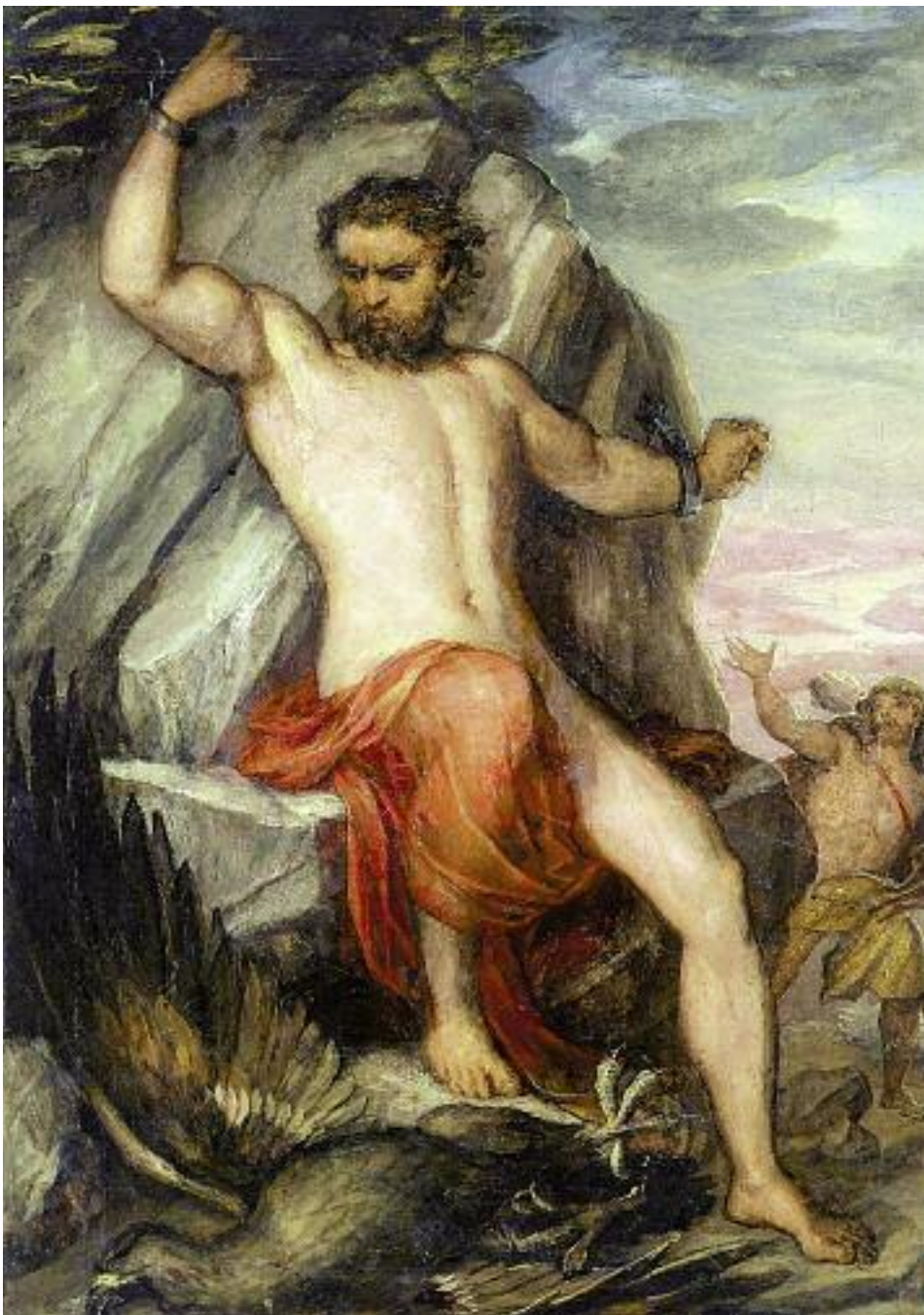
Карл Раль. Прометей. Около 1865 года

Флюиды раскованного Прометея модифицируют среду, меняют траектории, опровергают институты, демонстрируя образ вздернутого на дыбу человечества.