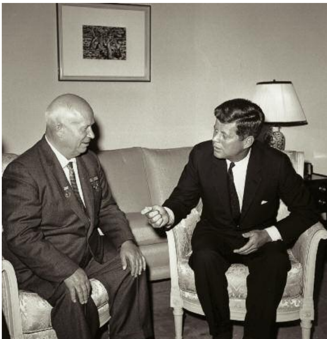
Встреча Никиты Хрущева и Джона Кеннеди в Вене в 1961 году

израстают из христианства, а вот поведенческий механизм, проистекающий из разного отношения к компромиссу, разносит их по разным этическим системам.