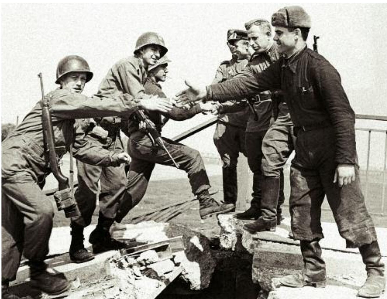
Встреча американских и советских солдат на Эльбе в 1945 году

ну самих исследований, отметим, что полученный результат сам по себе может быть изучен, дополнен, опровергнут, подтвержден в рамках продолжения исследований. Но как только он переходит в область политики — а он в нее давно внедрен, — он становится образцом, мерилom, ориентиром, нормативным делением стран на «хорошие» и «не очень хорошие», на «достигшие» и «не достигшие». Российская политика ориентируется на подобные зарубежные исследования, за недостатком собственных, и тем самым попадает в пространство, где ее место уже определено и направление должного движения обозначено. А должно быть не так. Задание системы координат — это сам по себе акт установления скелета