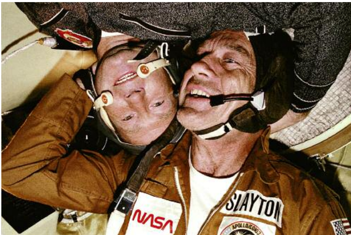
Дональд Слейтон и Алексей Леонов на борту орбитального модуля «Союз» в ходе проекта «Союз–Аполлон» в 1975 году

на и переведена в плоскость практической политики.