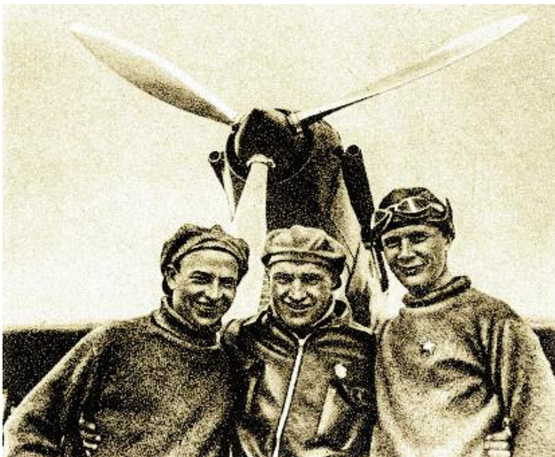
Валерий Чкалов, Георгий Байдуков и Александр Беляков в Ванкувере после беспосадочного перелета из Москвы через Северный полюс в 1937 году

Идеологи из ЦК КПСС боролись с американизацией. Они опасались проникновения признаков американского образа жизни — джинсов, рок-н-ролла, автомобилей... Но опасались не только этого — не такими уж поверхностными они были. Они боялись и самого главного: крушения «коммунистических идеалов» и пробуждения «мелкобуржуазных инстинктов». Боялись, боролись, но — проиграли. Проиграли, потому что не смогли определить, что является фундаментальной ценностью для большинства советских людей. Защищать надо было не те ценности, которые должны были быть, исходя из формул «самого верного учения», а те, которые имелись фактически. Все, что они успели осознать, это: «Мы не знаем страны, в которой живем». Важное осознание, но запоздалое. Как бы нам и сегодня не опоздать.