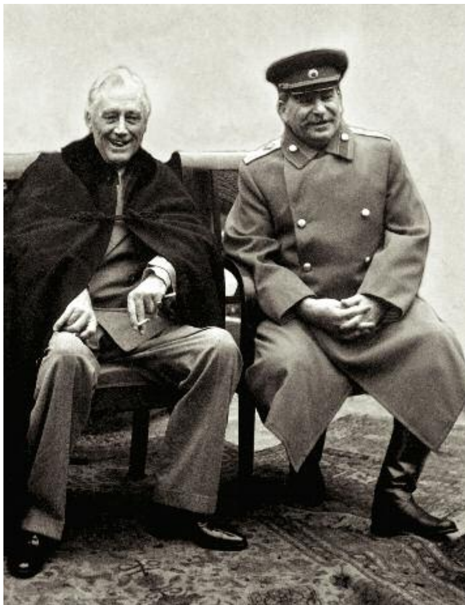
Франклин Рузвельт и Иосиф Сталин на Ялтинской конференции 1945 года

Театр военных действий в войне смыслов, в ценностном столкновении сложен и противоречив. Активными проводниками ценностных систем сейчас являются и те политические силы, которые принято именовать либералами, демократами, западниками, и те, которые называют консерваторами, государственниками, имперцами, православными русскими националистами. И если первую — прозападную — группу можно как-то мысленно объединить на основе более или менее определенного ценностного ядра, то во втором перечне объединительным является не общая позитивная ценностная часть — ее трудно определить, — а неприятие базовых прозападных ценностей. Картина усложняется апелляцией к православным ценностям. При этом неявно осуществляется некий не вполне ясный переход от ценностей религиозных к ценностям светским. Образ общества — страны, народа, государства, придерживающегося православных ценностей, — не описан, не сформулирован в категориях политических, экономических, институциональных. Вся эта важнейшая работа не проделана, а понятие «традиционные ценности» уже стало расхожим. Это опасная тенденция: отсутствие образа цели приводит к трагическим