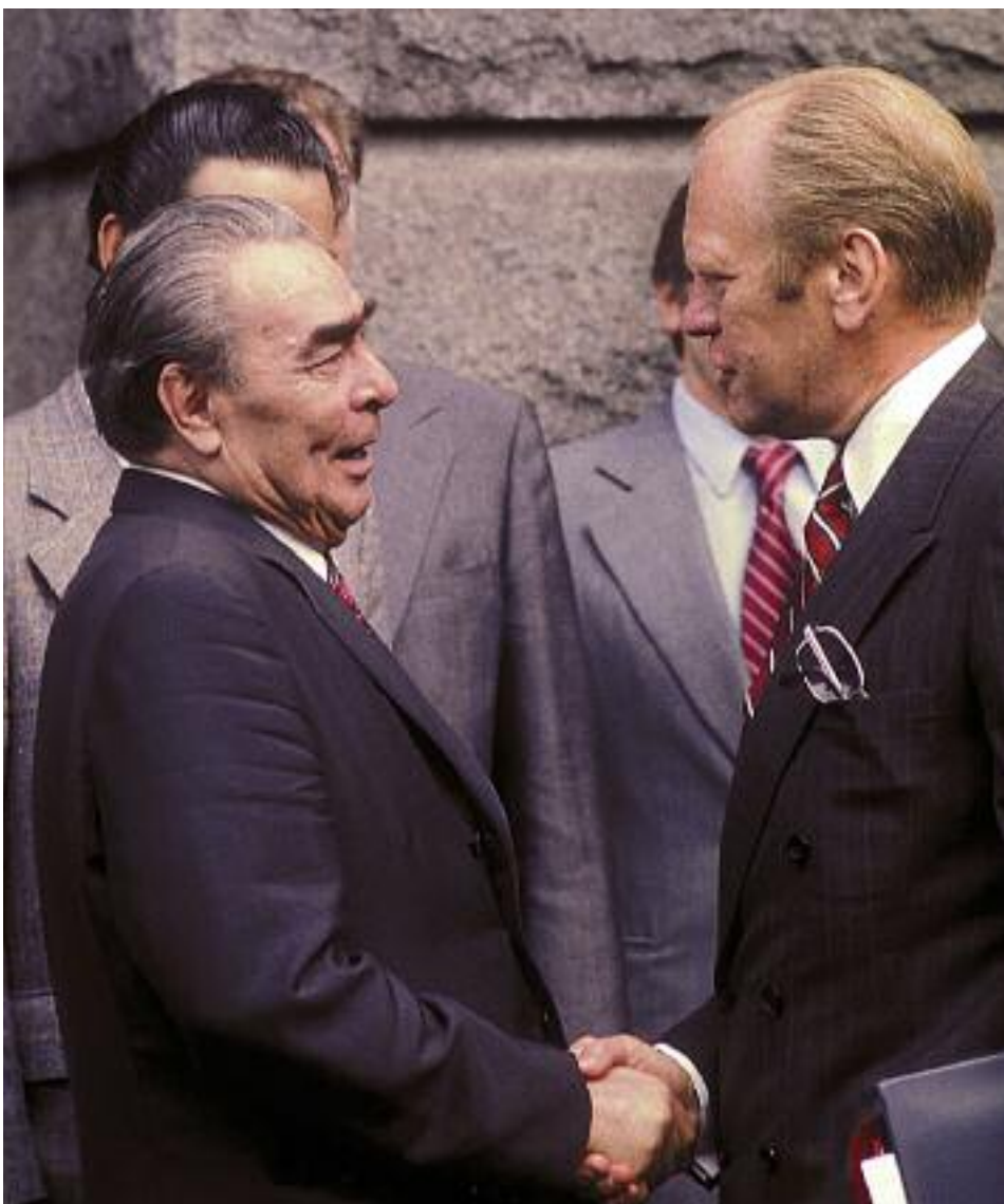
Леонид Брежнев и Джеральд Форд в Хельсинки в 1975 году