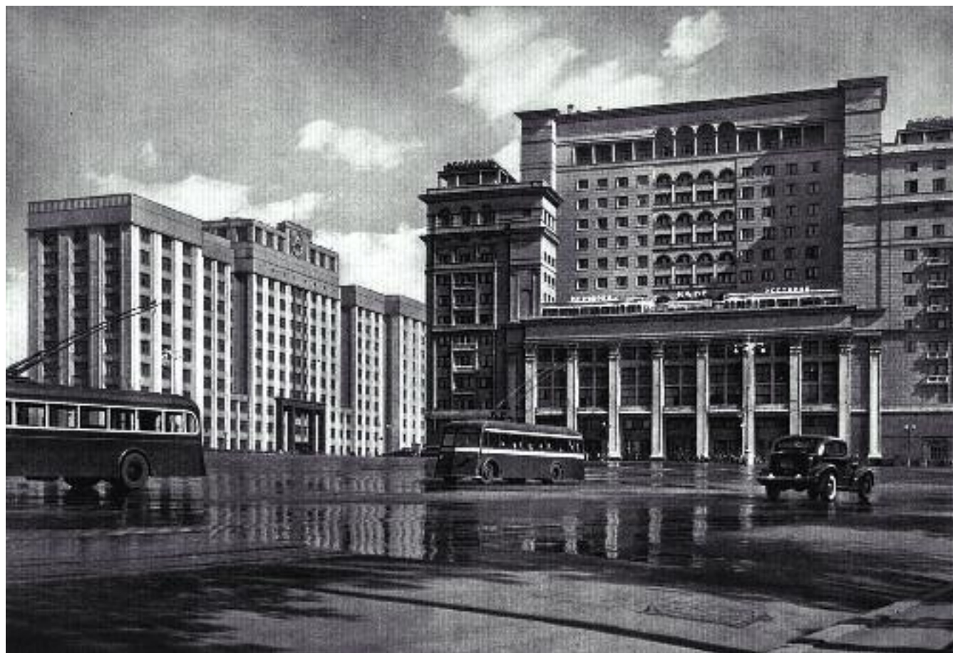
Здание Госплана СССР (на фото слева)

полагает создание своеобразного антикризисного штаба (далее – Штаб), в котором принимались бы все стратегические и оперативные экономические решения. Данный Штаб должен стать несущей организационной конструкцией мобилизационной экономики страны. Роль такой организации способно выполнить Министерство экономического развития (МЭР) РФ, деятельность которого должна претерпеть существенную перестройку.