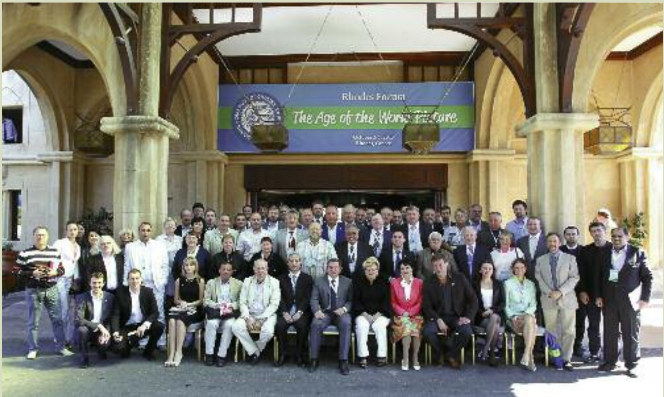
Родосский форум. 2013 год