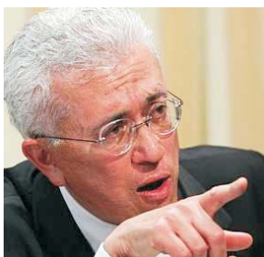
РОБЕРТУ МАНГАБЕЙРА УНГЕР – министр стратегического планирования Бразилии

Недостаточно просто отрегулировать рынок: надо реструктурировать институты, которые регулируют рыночную экономику. И направление, в котором эти реформы должны двигаться, имеет два уровня. Первый уровень – вертикальный, который обозначает отношения между государством и бизнесом. В мире сегодня есть две модели отношений между государством и бизнесом – американская модель, где государство регулирует бизнес как бы «издалека», и оппонирующая ей, где государство формулирует единую торговую политику и навязывает ее сверху вниз. Необходимо третья модель – модель сотрудничества государства и бизнеса, особенно небольших предприятий, которая будет децентрализованной и плюралистичной, основанной на широком участии трудящихся в управлении.