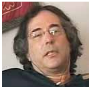
ПЕПЕ ЭСКОБАР – бразильский левый журналист и политолог, аналитик и обозреватель независимого американского информационного агентства The Real News (учредители – Гор Видал и Наоми Кляйн), автор регулярной колонки в . Автор книги «Globalistan: How the Globalized World is dissolving into Liquid War» (2007) Специально для РЖ

«Вашингтонский консенсус», умер, а новый порядок еще не установлен. Факт, что неолиберализм не просто явил себя как ужасающий в моральном отношении строй, но и как практическое бедствие – это показал начавшийся в 2008 году кризис. Конца этому бедствию не видно. Вашингтон спас Уолл-стрит (на средства налогоплательщиков) – и все вернулось к системе business as usual .