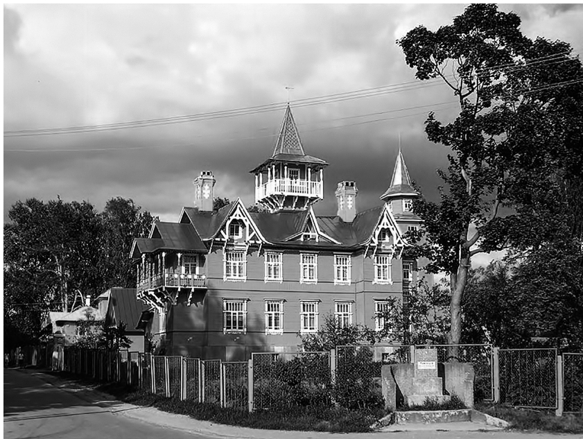
Дом чуриковцев в Вырице

группу трезвенников Ленинграда. В мае того же года начинается тотальная проверка всей коммуны, одна за другой приезжают комиссии. Все имущество подробно описывается, регистрируются земля, постройки, инвентарь и т. д. Проверяющие признали, что «сельхоз[ийственная] коммуна БИЧ является собою хорошо оборудованное индустриальное хозяйство». Однако в остальном «коммуна является штабом трезвенничества для распространения религиозной пропаганды среди населения. <...> Культурно-массовая работа не ведется, нет красного уголка... <...> ...Рядовые члены не знают о том, что они могут разрешать хоз[ийственные] вопросы коммуны, а говорят, что “нас Братец приютил, живем под его крылышком” и т. д. Отсюда видно, что коммуна не оправдывает своего названия, а больше смахивает на монастырское хозяйство» [ Апостол трезвости , 220].