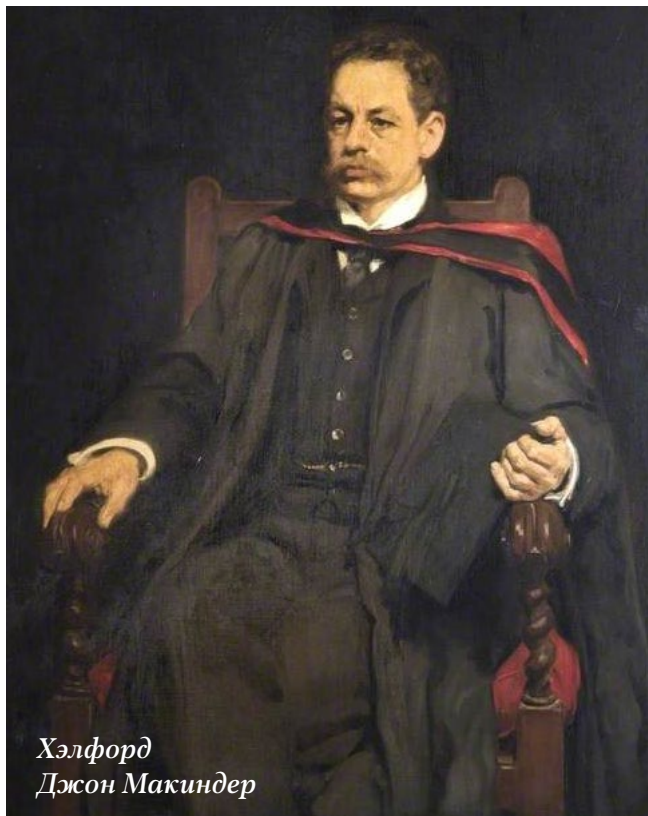
Хэлфорд Джон Макиндер

— Это был выдающийся человек. Мне понравилась его книга о мессианстве, однако, у меня не было возможности познакомиться с ним лично.