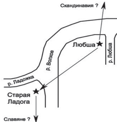
Любшанско-Ладожское смещение ядра

Смещение ядра. В качестве возможных триггеров, запустивших процесс данного смещения можно рассматривать несколько