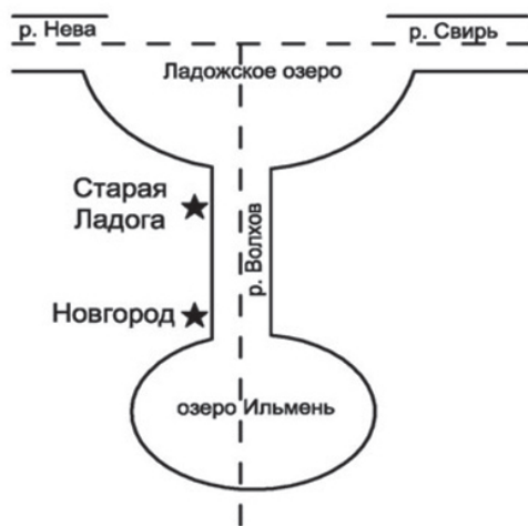
Ладожско-Ильменская двухъядерная система

Ладожско-Ильменская двухъядерная система. Старая Ладога и Новгород оказались «зажатыми» между двумя крупными озерами Ладожским озером с севера и озером Ильмень с юга. Данная конфигурация, в целом, походящая на Х-образную конфигурацию, призвана показать формирование двух крупных и значимых центров в пределах достаточно ограниченной области в условиях относительно большого расстояния между крупными селениями. Одновременно эта схема так же, как и предыдущая может содержать в себе идею о последующем перенесении центра влияния из Старой