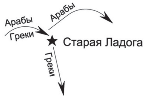
S-образная конфигурация относительно торговых путей «из варяг в греки» и «из варяг в арабы»

S-конфигурация. Старая Ладога основана под влиянием экзогенных факторов при поляризации в результате воздействия трех удаленных внешних точек влияния (Константинопольский, Каспийский – как промежуточный, Скандинавский центры воздействия). Предшествующее основанию города обретение торговых путей и их раз-