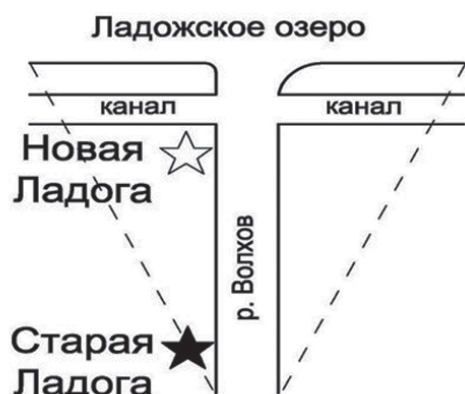
R-образная конфигурация относительно Новой Ладоги

«затухание» значимости Старой Ладоги, особенно заметное в свете появления нового городского поселения, ориентированного на актуальную государственную стратегию организации кораблестроительного производства Петра I – Новой Ладоги. Новая Ладога восприняла у Старой Ладоги функции «оплота» Российского государства.