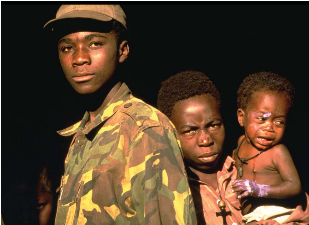
☞ Мальчик-солдат со своей семьей. Ангола, 2004 г.

Будучи ребенком, я был свидетелем рождения уличных банд в Соединенных Штатах, особенно Крипс и Бладс в Лос-Анджелесе. Я наблюдал за ними с момента их появления до того времени, когда они превратились в международные гангстерские банды. Я жил в голубом квартале, на территории банды Крипс, а мой двоюродный брат - в красном квартале, где царила банда Бладс. Мой брат стал членом красных. Если бы я присоединился к голубым, то мы стали бы врагами и могли бы убить друг друга. В зонах конфликтов в Африке, где армии повстанцев похищают детей, чтобы сделать их солдатами, маленькие двоюродные братья таким же образом могут стать врагами.