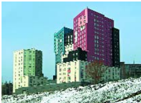
[ 2 ]