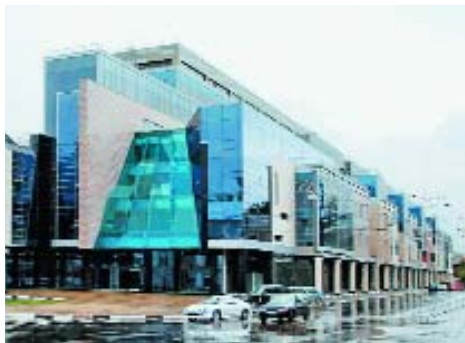
[ 4 ]