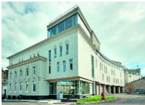
[ 1 ]

Но если расценивать действия «переводчиков» как фрейдистские оговорки, то желание свести всё к простому и спокойному вполне закономерно. Кондитеры, не ведающие о деконструкции, слепили параллелепипеды, шайбы, смягчили острые срезы, нарисовали «детские» окошки с форточкой вместо зеркальных полос и глухих окон, словно затормозив движение «Титаника». Это здание – вторая очередь банка «Гарантия», но оно не произрастает, а скользит, устремляется в неизведанную даль, по направлению к Кремлю, построенно русскими, наученными итальянцами. На пути этого движения – огромный овраг, сложный ландшафт, множество других непростых обстоятельств. Композиция «со сдвигом» получила дальнейшую интерпретацию уже позже в работе других архитекторов – из мастерской Виктора Быкова. Небольшой, по нынешним меркам, торговый центр в Рейтинге назвали «Айсбергом», поскольку он действительно похож на осколок, видимую часть того, что не сразу угадывается на поверхности. В отличие от ассоциативного «Титаника», в этом объекте послонно спрессована вся история взаимоотношений проектировщиков с контекстом: острое положение новостройки,