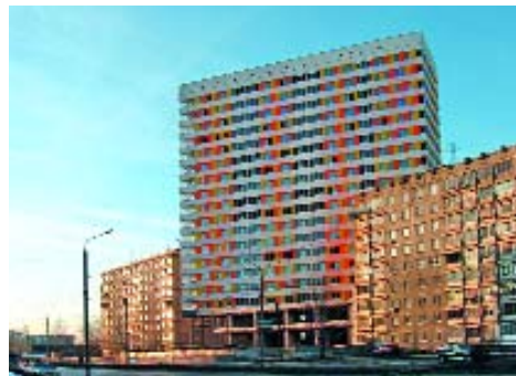
[ 6 ]