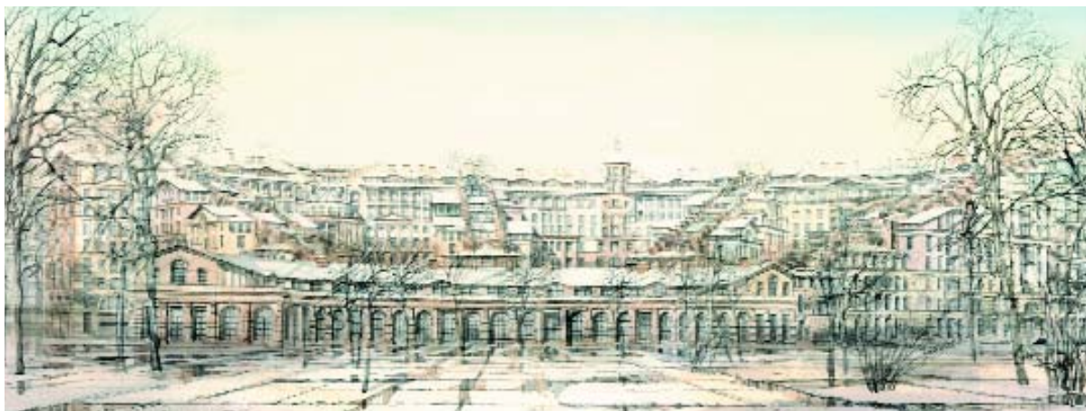
Проектное предложение «Итальянский квартал» до реконцепции. Проектировщик - мастерская М.Филиппова.