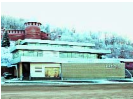
[ 7 ]