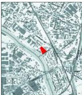
Схема расположения в городе.