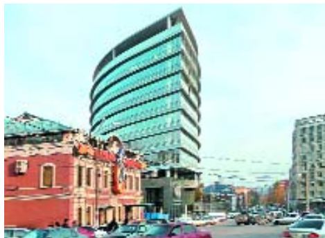
[ 3 ]