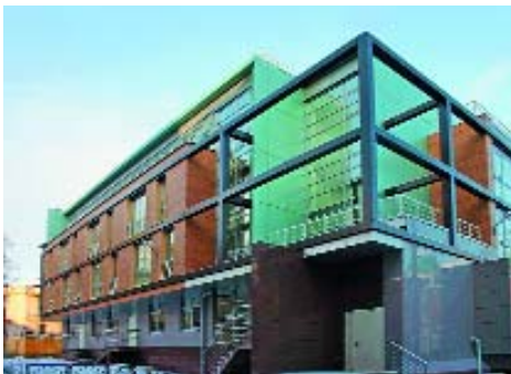
[ 5 ]

Марина Игнатушко Материалы предоставлены организаторами Рейтинга.