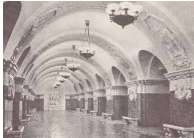
Первая постройка - станция метро «Краснопresненская». 1954 г. Архит. В.Егеров, М.Константинов, Ф.Новиков, И.Покровский.

И, должно быть, пока не родится архитектор, способный «перекроить», переосмыслить «штатные» инженерные курсы соответственно содержанию профессиональной деятельности, последующие поколения студентов и впредь будут тратить многие часы на познание того, с чем больше никогда в жизни не встретятся».