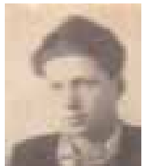
Фотография из зачетной книжки - 1944 г.