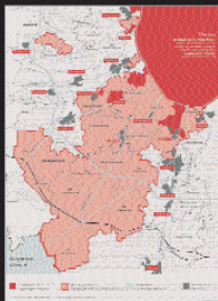
Игра в ножки задела не по-детски – к концу августа к новоиспеченной территории Москвы прирелись еще 16 тыс. га, в частности доведя границу в аквурт до Калужской области.

нее же никуда не деться, при этой власти или при любой другой, более склонной к стратегическому видению – неминуемо полечет за собой перестройку территориальной схемы развития Москвы и Московской агломерации. И, соответственно, нынешний срокопалитальный – отведенный срок две недели – выбор может автоматически осечь, по сути – немилосердно зарезать будущие перспективные варианты развития – власти как целого и Московского региона как ее составной части. К сожалению, власти не прислушиваются к мнению профессионалов – сегодня эта тенденция выглядит еще более отчетливо, чем в советские времена. Архитекторы и планировщики здесь не исключение.