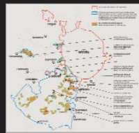
Умозрительная раскладка по Функциям – кто из слуг народа куда переезжает.

У читателя может возникнуть вопрос: к чему в публицистической статье такие академические подробности? А к тому, что новая концепция расселения страны – без