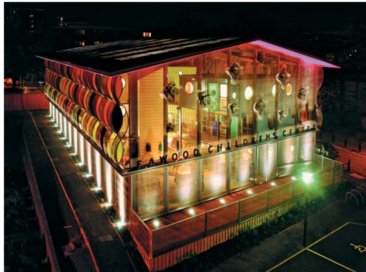
Детский центр в Фауде, Лондон. Олсон Архитектс в составе Арчиал Групп. 2006 г.

Как преобразуют города? Бывает, крупные трансформации происходят в результате внешнего воздействия. Например, когда армия Ирландской республики сбросила бомбу на Ман-