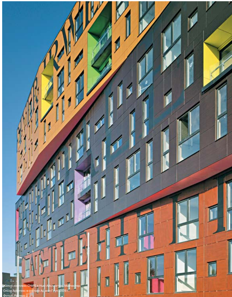
Житий комплекс CHPS в Нью-Амстердам, Мэнчестер. Олсон Архитектура в составе Арчизал Групп, 2009 г.