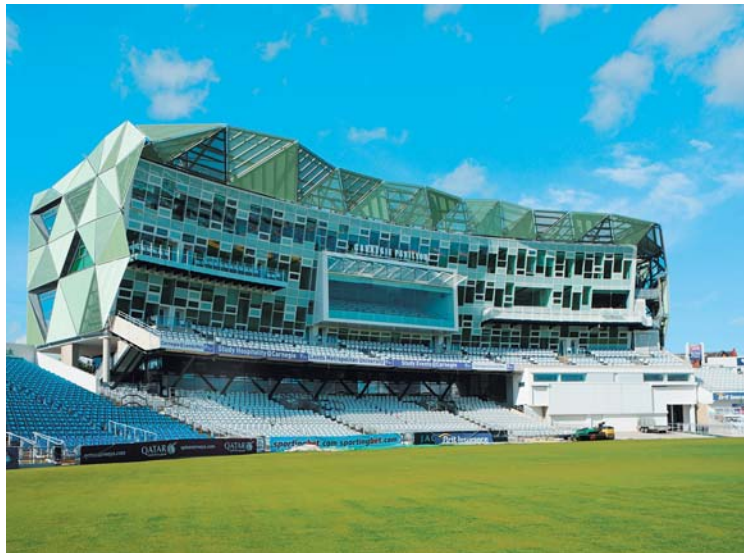
Карнеги-павильон в Хедингли Крикет-клубе, Лидс. Олсон Архитектс в составе Арчиал Групп. 2010 г.