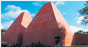
Здание музея художницы Паулы Рего. Португалия, Кашкайш. 2009 г.