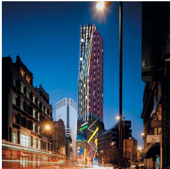
Проект Сити-Роуд Тауэр в Лондоне. Олсон Архитектс в составе Арчиал Групп. 2007 г.