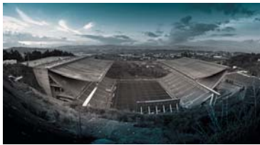
Футбольный стадион, Португалия, Брага. 2004 г