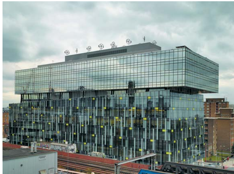
Комплекс «Палестра», Лондон. Олсон Архитектс в составе Арчиал Групп. 2006 г.

Если сравнить российскую столицу с европейскими и азиатскими мегаполисами, Москва – все же европейский город с европейской архитектурой. Однако это взгляд извне – стороннего наблюдателя. Не менее важно то, как сами москвичи воспринимают свой город, получают ли они удовольствие от