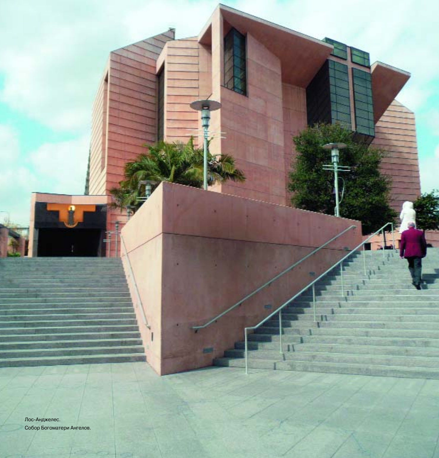
Лос-Анджелес. Собор Богородицы Ангелов.