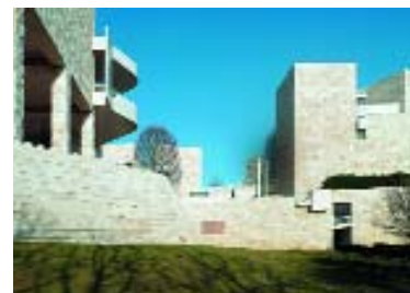
Лос-Анджелес. Музей Гетти.