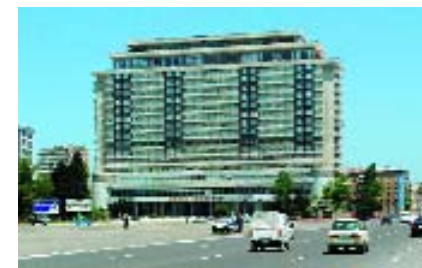
Баку. Гостиница «Апшерон».