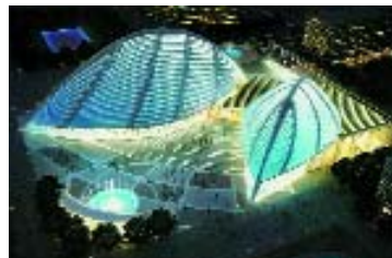
Баку. Проект «Белого города». Концертный зал.

тошные статуса памятников, приходишь к заключению, что в этих случаях главным архитектором города был Его Величество Манат – денежная единица, примерно равная евро. Но ведь и Москва страдала этой болезнью. И теперь в ряде случаев бакинские власти принимают решения о сносе некоторых неуместных зданий – подчас даже многоэтажных. Однажды мне встретилось мудрое утверждение Энгельса, относящееся к истории, которое я перефразировал применительно к градостроительству. В этом варианте оно звучит так: «Город складывается как сумма усилий противоречивых воль, в результате действия которых получается то, чего никто не хотел». Но лучший монолитный жилой дом советских времен, построенный по проекту А.Белокопья на Тбилисском шоссе, украсили «в хвост и в гриву», согласно единой коллективной воле сами его обитатели, как полагаю, без разрешения властей. Возможно квартиры они приватизировали – это их владения, но фасад приватизации не подлежит. Он – собственность всех бакинцев. Надо было сломать первый плод самостоятельности, вслед за ней второй, и тогда никто больше не позволил себе подобное. И я не могу не сказать о неуместности приобретенных по случаю китайских фонтанов, появившихся в городских скверах, при том, что один из них, стоит перед зданием Академии наук, капители колонн которого позолочены в целях цветового единства. Однако есть и бесспорные обретения. Это