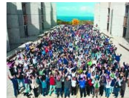
Сан-Диего. Юбилей Института Солка.