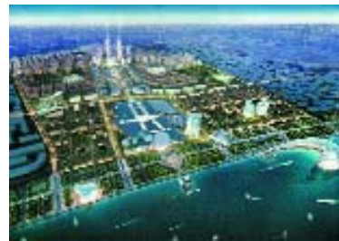
Баку. Проект «Белого города». Ночной вид.