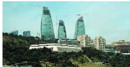
Баку. Комплекс зданий «Огни Баку».