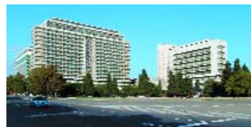
Баку. Гостиница «Азербайджан».