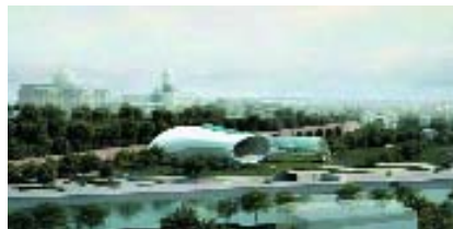
Тбилиси. Вид речного фасада.

ональны. Однако новаторская форма способна ассимилироваться в исторической среде, и тому есть множество примеров. Весь вопрос в том, как она сделана. Я никак не могу согласиться с утверждением уважаемого академика, сказавшего о Москве: «С фундаментальной идеей возможности существования абсолютно нового в городе необходимо бороться». Полагаю, что идеологи отрицания новой архитектуры и пропагандисты классических форм не привлекут на свою сторону заметное большинство мирового профессионального сообщества. Разве, что воскресший Сталин возглавит Всемирное Правительство. Я крайне скептически отношусь к провозглашенным установкам нового мэра Москвы. Чем-то они подобны политике, 20 лет проводимой в столице приснопамятным В.В.Гришиным. А чем она кончилась? Как и всякое воздержание, своей бурной противоположностью, издержки которой очевидны. Убежден, что подобный запретительный абсолют городу и его центру вреден. Но каждая конкретная площадка требует должного подхода – и в каких-то обстоятельствах решительного. Как это, к примеру, случилось с проектом здания Геликон-оперы.