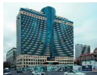
Баку. Отель «Хилтон».