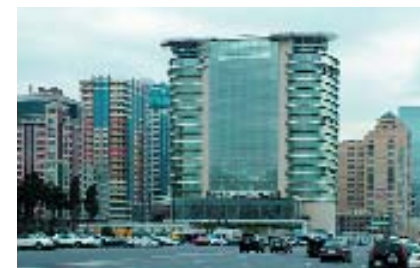
Баку. Отель «Марриот».