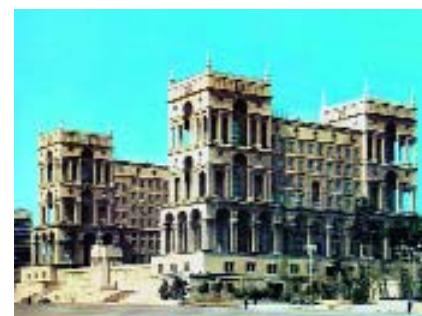
Баку. Дом Правительства.