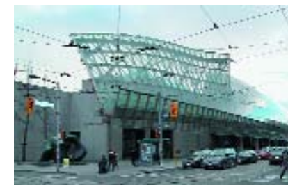
Торонто. Художественная галерея Онтарио.