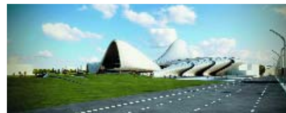
Баку. Проект Центра Гейдара Алиева.