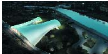
Тбилиси. Проект театра современной музыки.

лиси. Впрочем, известны конкурсные победы проектов, присланных из дальних стран, авторы коих опирались лишь на исходную документацию. И хотя на эскизах Фуксаса мост отсутствует, с ним у этой постройки противоречий не возникнет.