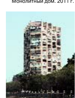
Баку. Монолитный дом. 2011 г.