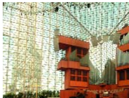
Гарден Гров. Интерьер Собора.