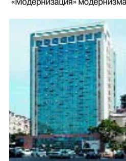
Баку. «Модернизация» модернизма.