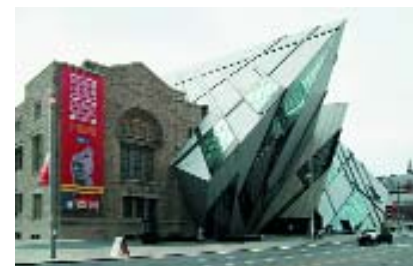
Торонто. Королевский музей Онтарио.