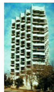
Баку. Монолитный дом. 1975 г.