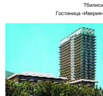
Тбилиси. Гостиница «Иверия».