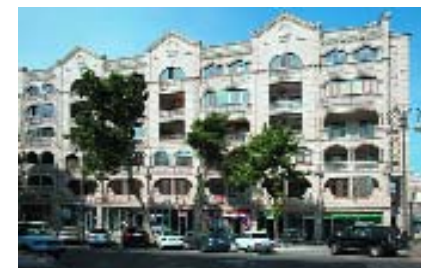
Баку. «Классицизация» модернизма.